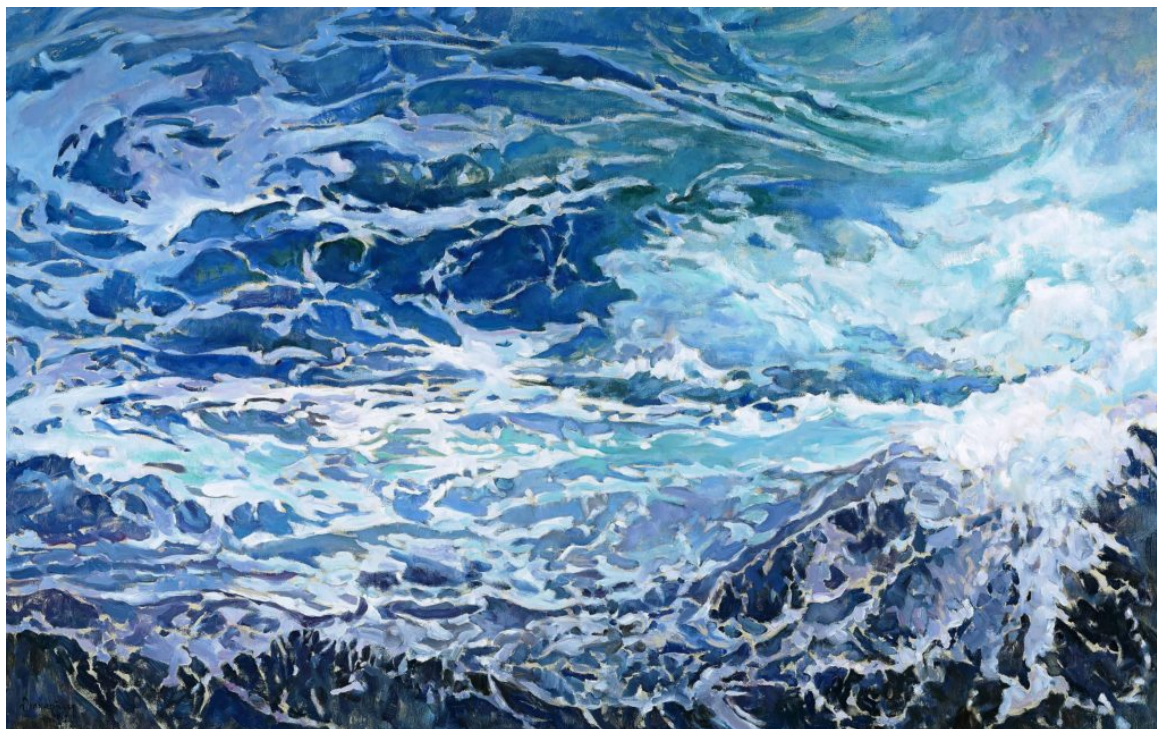
Μέσα στην αντάρα της θάλασσας, 2012 Βασίλης Θεοχαράκης Λάδι σε μουσαμά, 125 x 200 εκ. Ιδιωτική Συλλογή

Η επιμελήτρια της έκθεσης Λαμπρινή Καρακούρτη-Ορφανοπούλου, αναφερόμενη στον τίτλο και στο θέμα της έκθεσης, τονίζει μεταξύ των άλλων: «Παρά θίν' αλός: η ομηρική φράση της Ιλιάδας, αποτελεί πολύτιμο λίθο της γλωσσικής μας παρακαταθήκης και συνάμα μας ταξιδεύει στο λεκτικό πλούτο που δημιουργήσαμε ως λαός, αναφερόμενοι στον απέραντο και μαγικό κόσμο της θάλασσας. Η θάλασσα στο ομηρικό έπος, το αρχετυπικό και πανάρχαιο σύμβολο της περιπλάνησης και περιπέτειας του ανθρώπου, θα ταυτιστεί με το ταξίδι, θα καθορίσει τον ελληνικό πολιτισμό και την ιστορική του συνέχεια. Το θέμα της έκθεσης, η θάλασσα, άμεσα συνδεδεμένη με τη ζωή του ελληνικού λαού, την ιστορία του, τα βιώματά του αποκτά συμβολικό χαρακτήρα στις μέρες μας και προτείνει στον επισκέπτη της έκθεσης, ένα ταξίδι πλημμυρισμένο από το φως και το χρώμα της Ελλάδας, παρακολουθώντας όλα τα στάδια της θαλασσογραφίας, από τα μέσα του 19ου αιώνα έως στις μέρες μας.