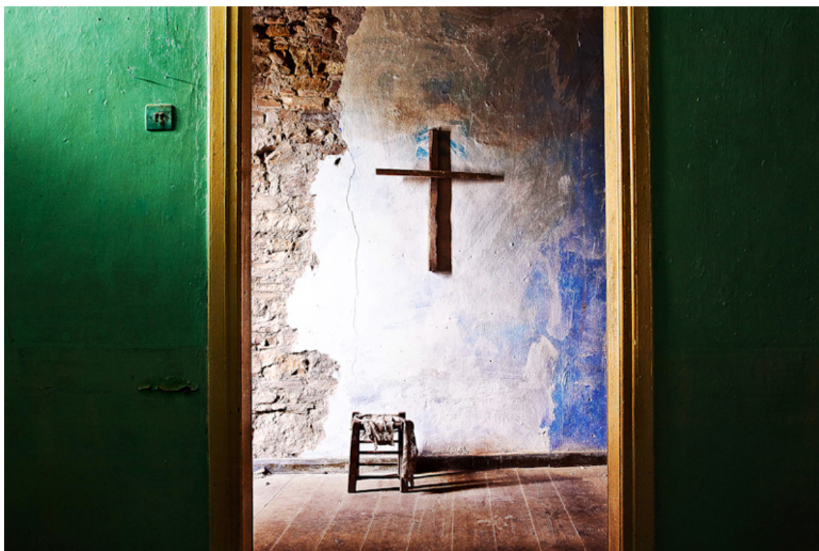
«Εσωτερικός κόσμος - Μαστιχοχώρια», του Στρατή Βογιατζή. Χωριό Καταρράκτης.

Ο Στρατής Βογιατζής γεννήθηκε στη Χίο και σπούδασε Οικονομικά στο Αριστοτέλειο Πανεπιστήμιο Θεσσαλονίκης και στο Πανεπιστήμιο του Άμστερνταμ. Συμμετείχε σε διάφορες φωτογραφικές αποστολές στην Ινδία, το Βιετνάμ, το Μαρόκο, το Ιράν, το Μεξικό και την Τουρκία. Δούλεψε με τους Ρομά στα περίχωρα της Θεσσαλονίκης και πραγματοποίησε για την Ύπατη Αρμοστεία του ΟΗΕ, ρεπορτάζ με θέμα τους πρόσφυγες στο Κόσοβο και τα παιδιά και τη πολιτική βία στην Παλαιστίνη.