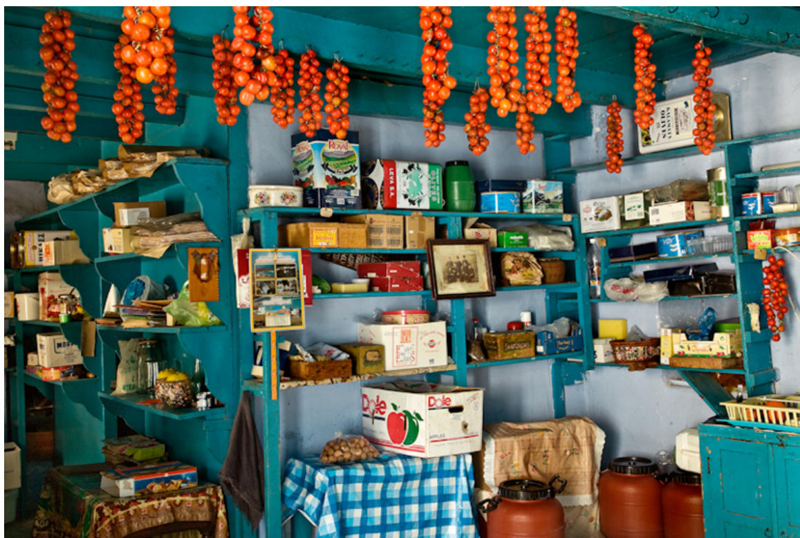
«Εσωτερικός κόσμος - Μαστιχοχώρια», του Στρατή Βογιατζή. Χωριό Λιθί.

Μετά την συμμετοχή του στην Φωτομπιεννάλε της Θεσσαλονίκης το 2010, μια σειρά από εκθέσεις ανέδειξαν το έργο του σε μεγάλες πόλεις του εξωτερικού. Από το 2011 ασχολείται και με το βίντεο και τα ντοκιμαντέρ του συμμετείχαν σε σημαντικά διεθνή φεστιβάλ. Στις αρχές του 2014 συμμετείχε στην έκθεση «Ναυτίλος: Ταξιδεύοντας την Ελλάδα», την κορυφαία πολιτιστική εκδήλωση Ελληνικής τέχνης που διοργανώθηκε στο Μουσείο Bozar των Βρυξελλών, με την ευκαιρία της Ελληνικής Προεδρίας της Ευρωπαϊκής Ένωσης. Ο Στρατής Βογιατζής είναι ένας από τους 24 σύγχρονους Έλληνες δημιουργούς, που επιλέχθηκαν να εκπροσωπήσουν την σύγχρονη Ελληνική τέχνη, σε έναν τολμηρό και δημιουργικό διάλογο, με 93 αρχαιολογικούς θησαυρούς, από 29 Ελληνικά αρχαιολογικά μουσεία, με στόχο να παρουσιαστεί μέσα από αυτή την έκθεση το παρελθόν και το μέλλον της εικαστικής δημιουργίας στην χώρα μας.