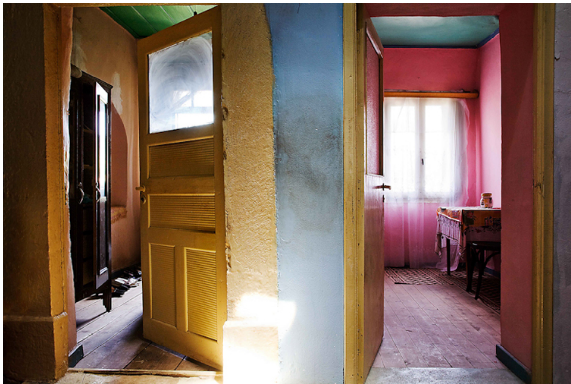
«Εσωτερικός κόσμος - Μαστιχοχώρια», του Στρατή Βογιατζή. Χωριό Καλαμωτή.

Η παντελής απουσία της ανθρώπινης φιγούρας χαρακτηρίζει όλες τις φωτογραφίες, αλλά πίσω από κάθε λεπτομέρεια, πίσω από κάθε διάκοσμο, διαφαίνεται η έντονη παρουσία του ανθρώπου με τις συνήθειες, τις παραδόσεις και τις ιδιαιτερότητες του κάθε νοικοκυριού. Μια ματιά σε έναν κόσμο που χάθηκε και ταυτόχρονα μια ενδοσκόπηση στον εσωτερικό κόσμο και την ταυτότητα του ίδιου του δημιουργού.