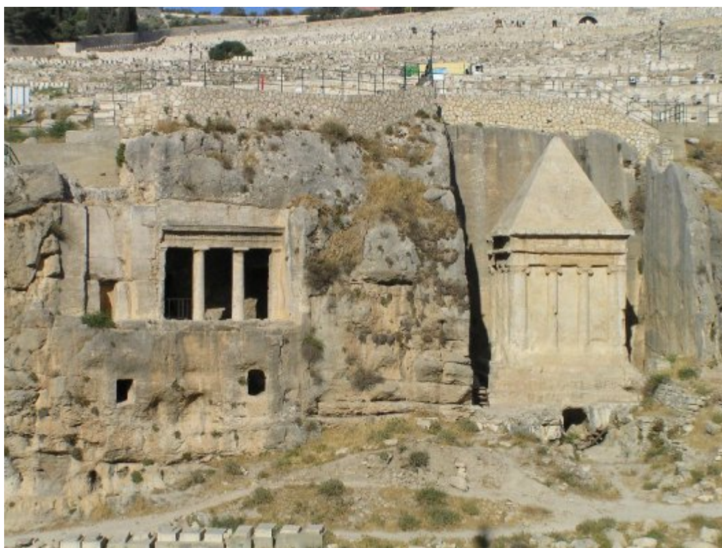
OLYMPUS DIGITAL CAMERA

Οι τάφοι που αναφέραμε ήδη ανήκαν σε ευκατάστατες οικογένειες, οι οποίες είχαν τη δυνατότητα να κατασκευάσουν και να συντηρήσουν μνημείο τέτοιου μεγέθους.