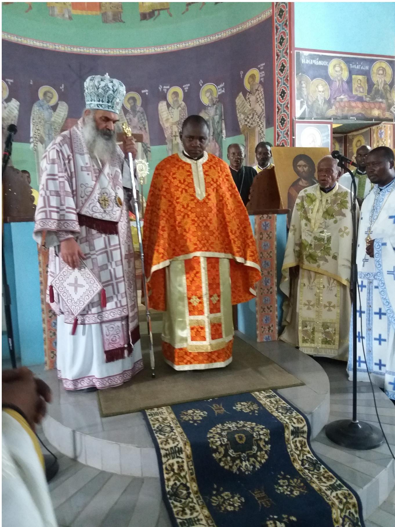
Ακολούθησε η λιτανεία της Εικόνας του Αγίου Ανδρέου όπου και τελέστηκε