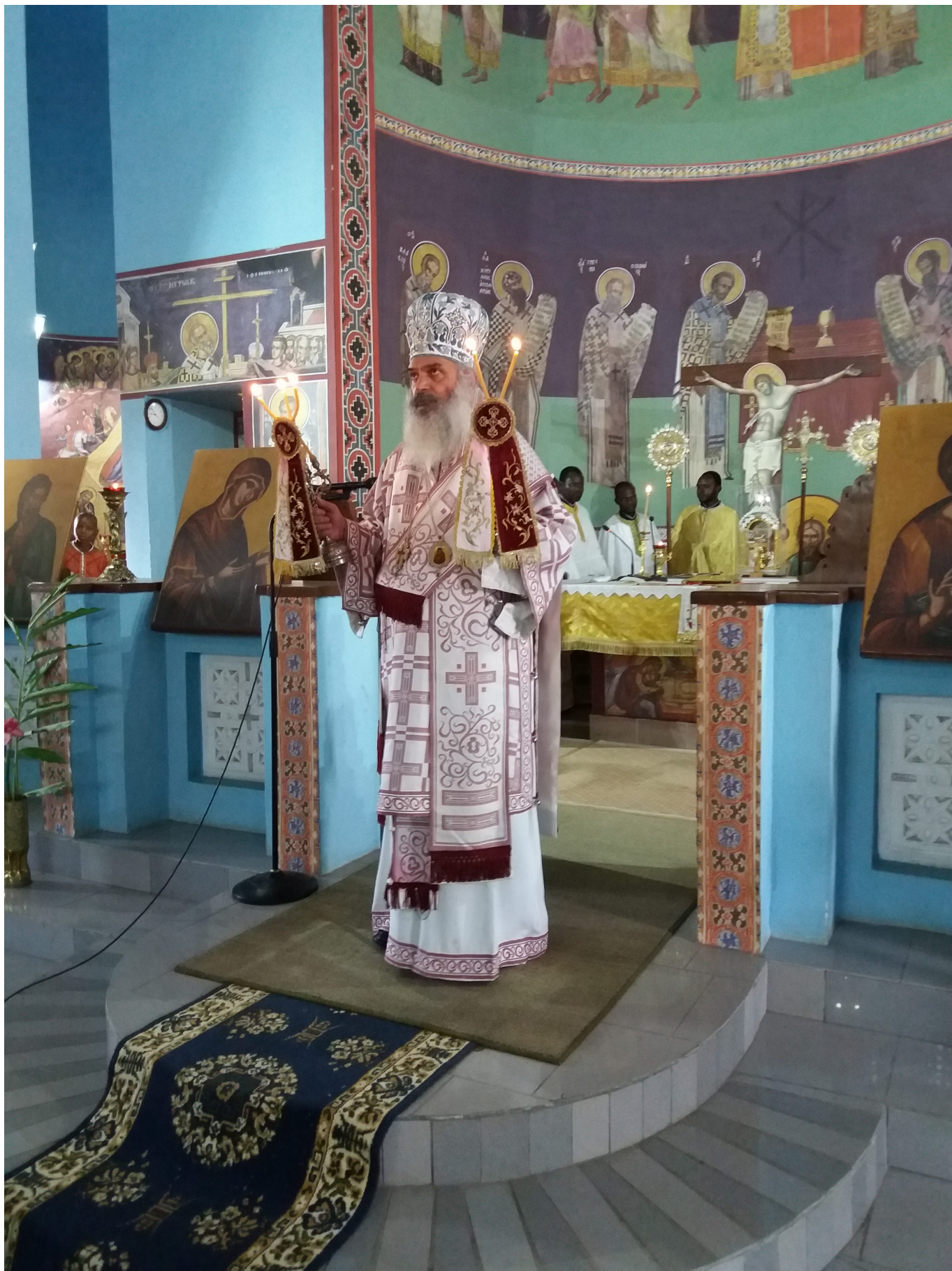
Ο π. Θεοδόσιος από καρδιάς, ευχαρίστησε τον Μακαριώτατο για την νέα διακονία