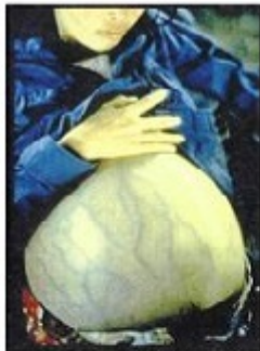
Hepatitis B Kaibimoh Sab Dhaaj Hoom B

Πέτρος Παναγιωτόπουλος, Αν. Καθηγητής Θεολογικής Σχολής ΑΠΘ