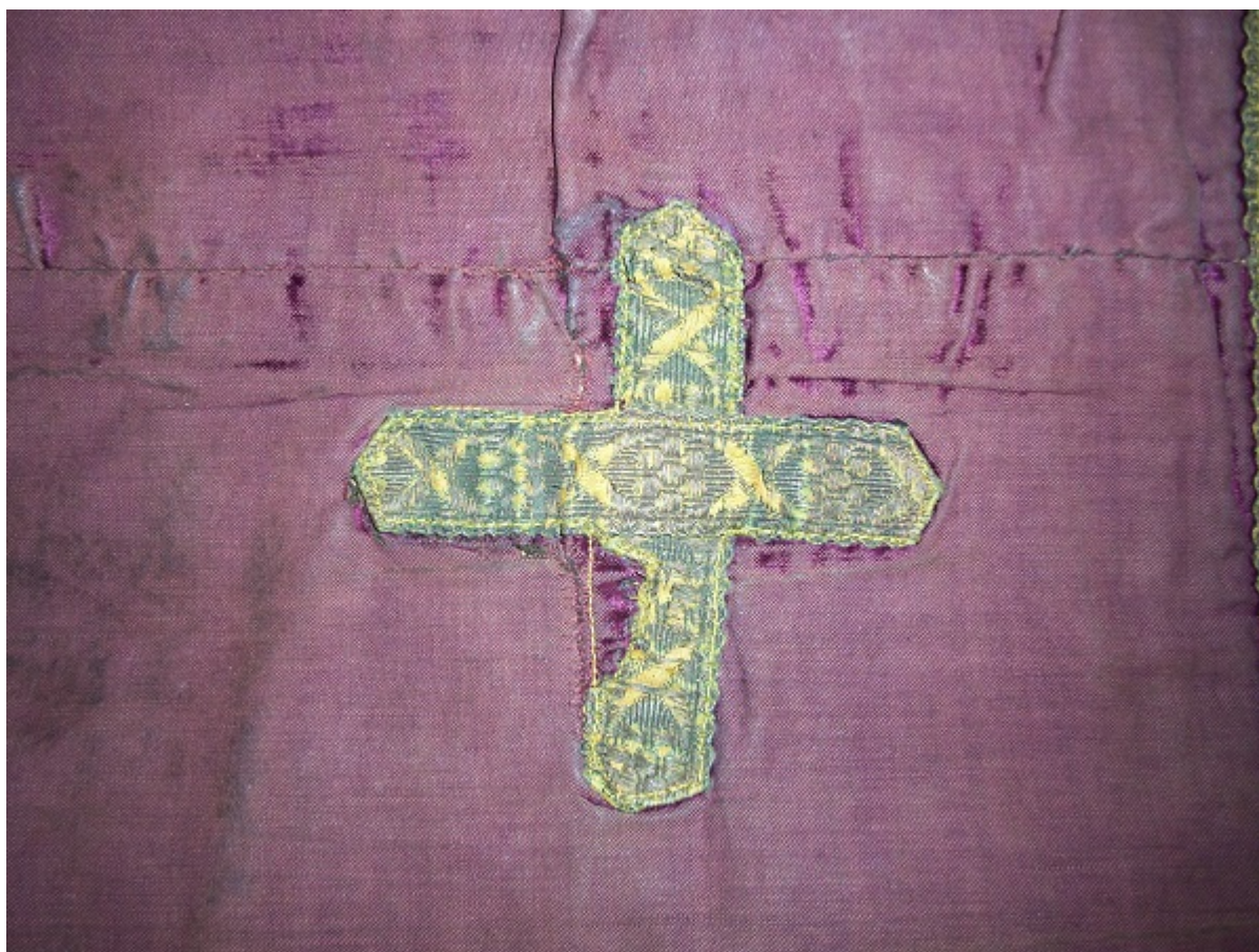
Εικ 3 Λεπτομέρεια σταυρού.

Ο κάμπος του επιτραχηλίου είναι κατασκευασμένος από κόκκινο μεταξωτό βελούδο όπου διακοσμείται με τρεις (3) μεγάλους σταυρούς, (Εικόνα 3) κατασκευασμένοι από μεταλλικά πεπλατυσμένα νήματα και με άλλους δύο (2), ίδιου τύπου στο σημείο του στήθους. Όμοια υλικά και διάκοσμο έχουν χρησιμοποιηθεί και για το περιμετρικό σειρήτι. Οι μέγιστες διαστάσεις του αντικειμένου είναι: 1.33 x 27,5εκ. Στο πίσω μέρος του τραχήλου το σημείο διακοσμείται με ένα μικρό σταυρό (Εικόνα 4). Περιμετρικά το επιτραχήλιο διακοσμείται με μεταλλικό σειρήτι. Το ένδυμα δεν φέρει διακοσμητική παρυφή και απολήγει σε μεταλλικά κρόσσια όπου είχαν τοποθετηθεί νεώτερα.