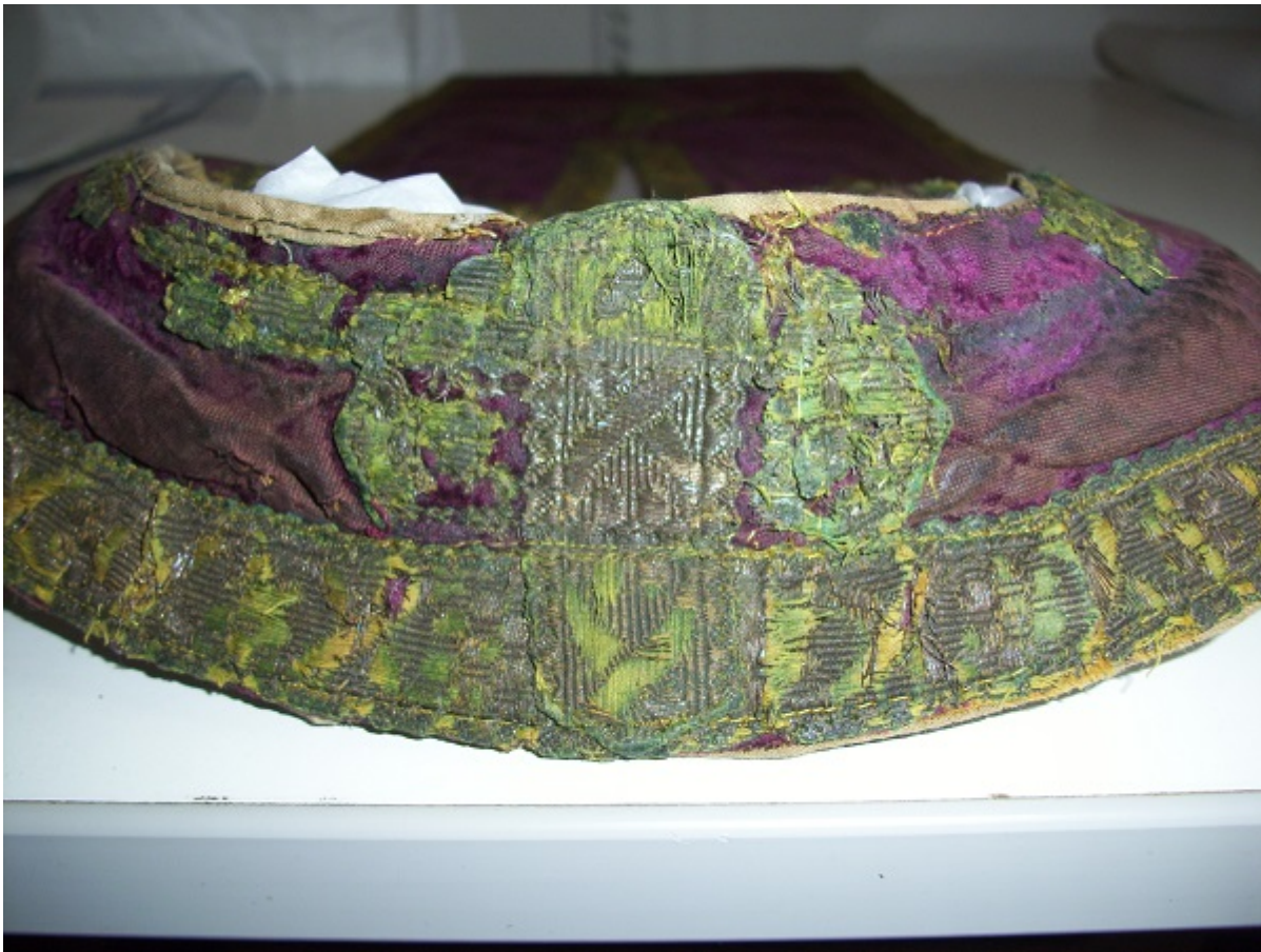
Εικ. 7 Λεπτομέρεια μετά την στερέωση και την επιπεδοποίηση του σημείου.

Τέλος, πραγματοποιήθηκαν στερεωτικές επεμβάσεις με μεταξωτό νήμα ακολουθώντας τις βελονιές 'couching' και μικρή μεγάλη 'short & long' όπου ήταν δόκιμο και εφικτό στην στερέωση των μεταλλικών νημάτων και του υφασμάτινου κάμπου (Εικόνα 7).