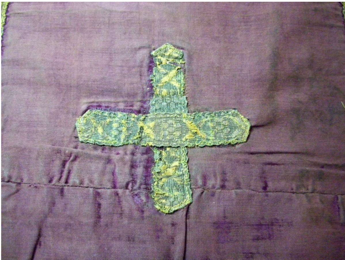
Εικ. 2 Λεπτομέρεια ένωσης υφασμάτων στον κάμπο.