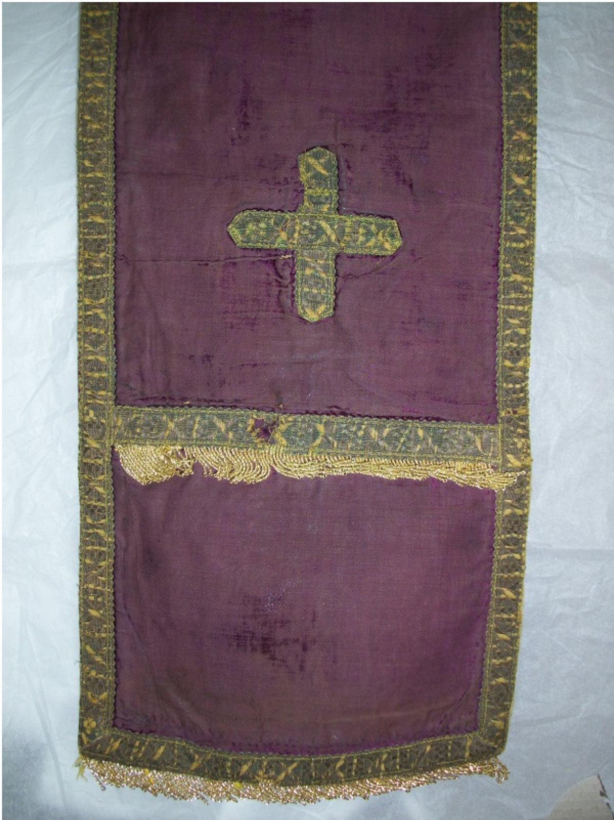
Εικ. 6 Τα νέα κρόσσια που είχαν τοποθετηθεί και δεν αφαιρέθηκαν κατά την διάρκεια της συντήρησης.

γαζώματος δεν επέτρεπε την αφαίρεση της διότι τα μεταλλικά νήματα δεν ήταν σε καλή σταθερή κατάσταση.