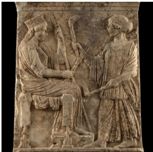
Το ανάγλυφο με την παράσταση Δήμητρας και Κόρης

Η Ελευσίνα και τα μεγάλα μυστήρια είναι το θέμα της νέας περιοδικής έκθεσης που εγκαινιάζει το Μουσείο της Ακρόπολης , την Κυριακή 25 Φεβρουαρίου 2018 . Η έκθεση θα λειτουργήσει για το κοινό από τη Δευτέρα 26 Φεβρουαρίου 2018 έως την Πέμπτη 31 Μαΐου 2018 .