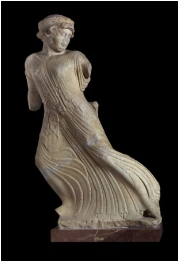
Το άγαλμα της Φεύγουσας Περσεφόνης

Στην έκθεση περιλαμβάνονται και ευρήματα από το Ελευσίνιο της Αθήνας αλλά και την Ιερά Οδό, δεδομένου ότι η πανηγυρική πομπή ξεκινούσε από την Αθήνα με πλήθος μνημένων και υποψηφίων για μύηση και κατέληγε στο τελεστήριο της Ελευσίνας. Για το λόγο αυτό παρουσιάζεται, πριν από την είσοδο στην έκθεση, ένα ανάγλυφο από την περιοχή του Ελευσινείου και ορισμένα χαρακτηριστικά ευρήματα από το Ιερό της Αφροδίτης που βρίσκεται δίπλα στην Ιερά Οδό, στην περιοχή του Δαφνίου.