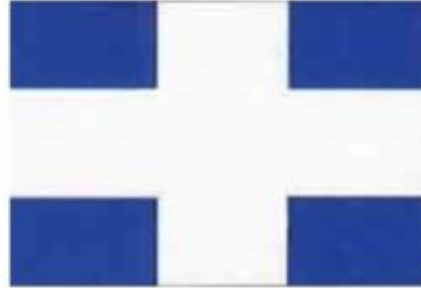
Σημαία οπλαρχηγού Ιωάννη Σταθά