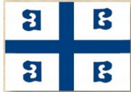
Ναυτική Σημαία Παλαιολόγων (μέσα 13ου αι. - 1453)