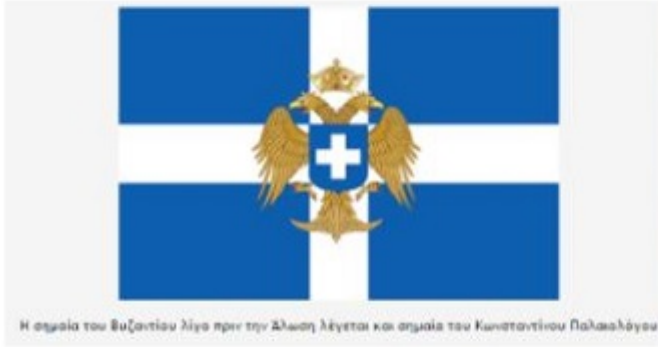
Η σημαία του Βυζαντίου λίγο πριν την Άλωση λέγεται και σημαία του Κωνσταντίνου Παλαιολόγου