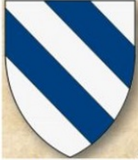
Οικόσημο Αγελάστων (9ος αι.)