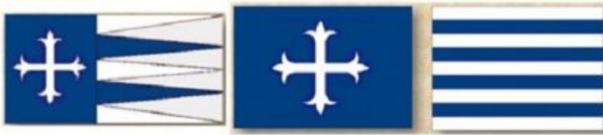
Δρούγγος των Ελλαδικών