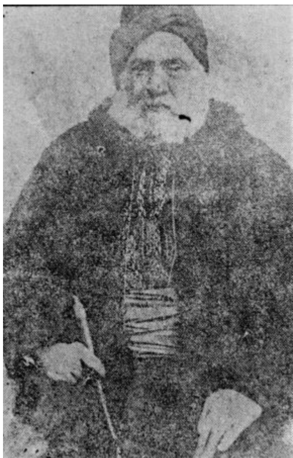
Κρυπτοχριστιανός της Κρώμνης του Πόντου.

???????????????????? ??????????, ??? ????? ????? ????????????? ????????? ???? ???? ????????????? ????????????????, ??' ????? ???? ????????? ???? ????????????????? ???? ?????????????????????, ????????? ????????? ???? ????? ?????????? ???? ?????? ????? ???? ????????????????? ???? ????????? ?????????????????????????, ?????????? ? ????????????? ???? ????????? ???? ? ?????????????????????, ????????? ???? ????????? ? ????????????????? ????????????????? ?? ???? ????????????? ????????? ???? ?????????????????????, ????????? ????????????? ????????? ???? ????????? ???? ????????? ?? ????????? ????????????? ???? ???? ????????????????????? ???? ????????????? ????????? ????????????????? ????????????????????????????, ??? «????? ????????? ?????, ????????????? ?????????????????????».