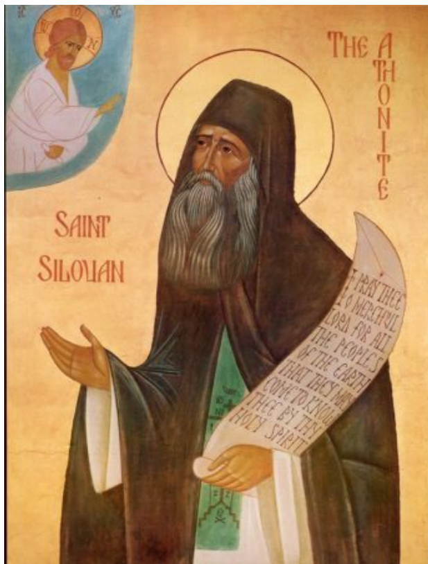
Ο Άγιος Σιλουανός ο Αθωνίτης.

Ωστόσο, η ελάττωση αυτή του αριθμού των μοναχών το 1971 ανακοβόταν και εμφανιζόταν η άνοδος. Στη συνέχεια, η άνοδος αυτή θα επιταχυνόταν μ' έναν ανέλπιστο ρυθμό. Χάρη στην άφιξη πολυαρίθμων δοκίμων και νέων μοναχών, τα μοναστήρια που δεν αριθμούσαν πια παρά μερικούς γέροντες θα ξανάπαιρναν ζωή το ένα μετά το άλλο.