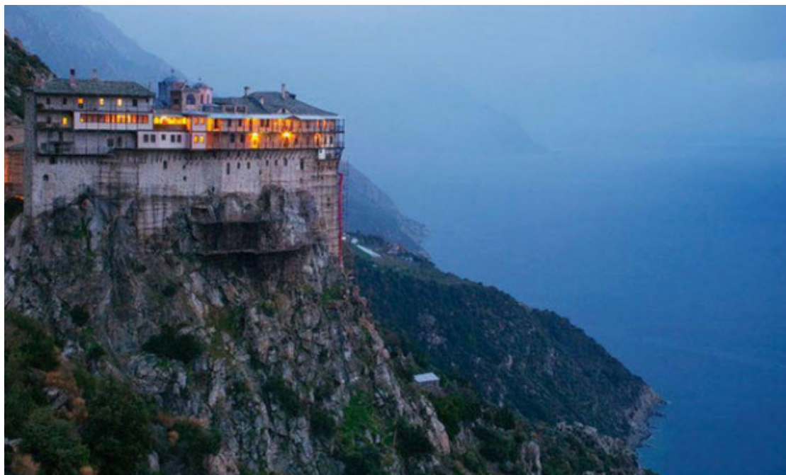
Ιερά Μονή Σίμωνος Πέτρα, Άγιον Όρος.

Αυτό το πρώτο ταξίδι, μας είχε ήδη επιτρέψει να καταλάβουμε ότι οι κατηγορίες της «παρακμής» ή, αντίστροφα, της «ανανεώσεως» είναι αρκετά αταίριαστες, όταν μιλούμε για τον ορθόδοξο μοναχισμό. Φέρνουν στο νου μας κυρίως την εξωτερική, κοινωνιολογική και στατιστική όψη των πραγμάτων. Η ουσία, ωστόσο, βρίσκεται στην εσωτερική ζωή, η οποία ξεφεύγει από εξετάσεις αυτής της τάξεως. Υπήρξε, πράγματι, μια τεράστια πτώση στους αριθμούς.