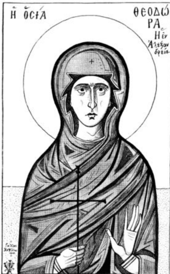
Αγία Θεοδώρα ἡ ἐν Ἀλεξανδρεία (ἔργο του Ράλλη Κοψίδη).

Κοντά στο μοναστήρι που ασκήτευε ἡ αγία Θεοδώρα υπήρχε μια λίμνη, όπου φώλιαζε ἕνας κροκόδειλος, ὁ οποίος καταβρόχθιζε ἀμέσως καθένα που τύχαινε να