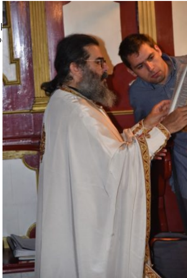
Μονή της ναχές.