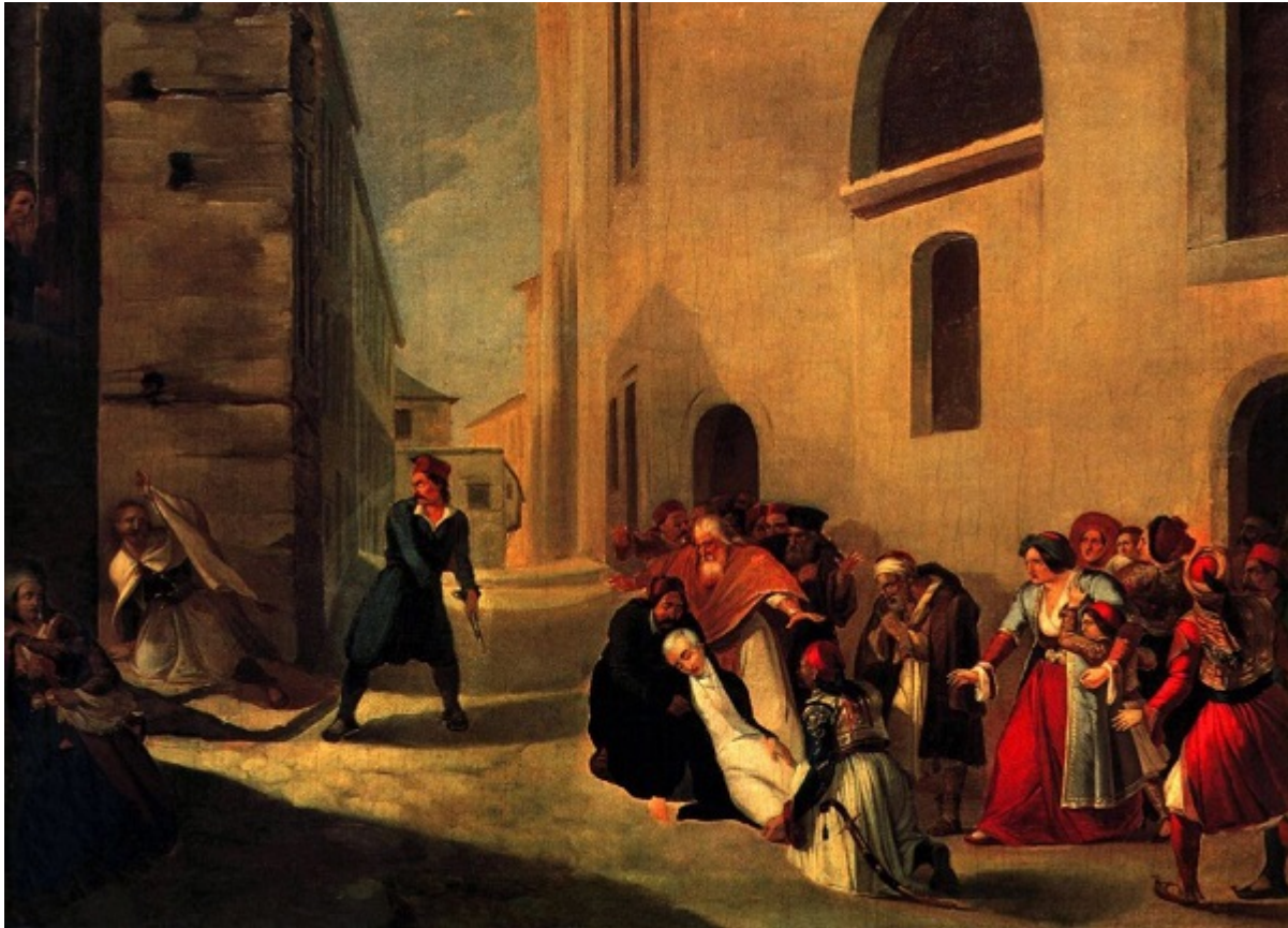
Διονυσίου Τσόκου: «Η δολοφονία του Ιωάννη Καποδίστρια» λάδι σε καμβά, 60 X 81 εκατ. Μουσείο Μπενάκη.

δικό του τρόπο να τον εμποδίσει να κατέβει την σκάλα του κυβερνείου.