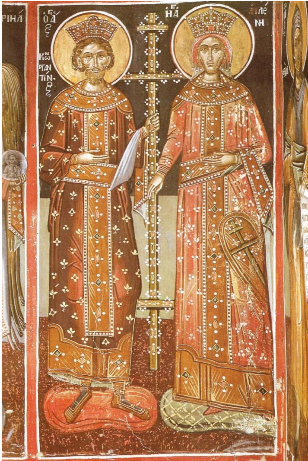
Οι ένδοξοι Θεόστεπτοι βασιλείς και ισαπόστολοι Κωνσταντίνος και Ελένη. Τοιχογραφία καθολικού Ι.Μ. Ρουσάνου Μετεώρων.

Στα έξι αυτά αγιομετεωρίτικα μοναστήρια, φορτωμένα με τις μνήμες του πολυτάραχου αλλά και ένδοξου βυζαντινού και νεώτερου παρελθόντος τους, μέσα στην υποβλητική σιωπή και μυστηριακή γαλήνη των καταυκτικών και αδιάλειπτων προσευχών, παρελθόν και παρόν, ιστορική μνήμη και αυστηρή