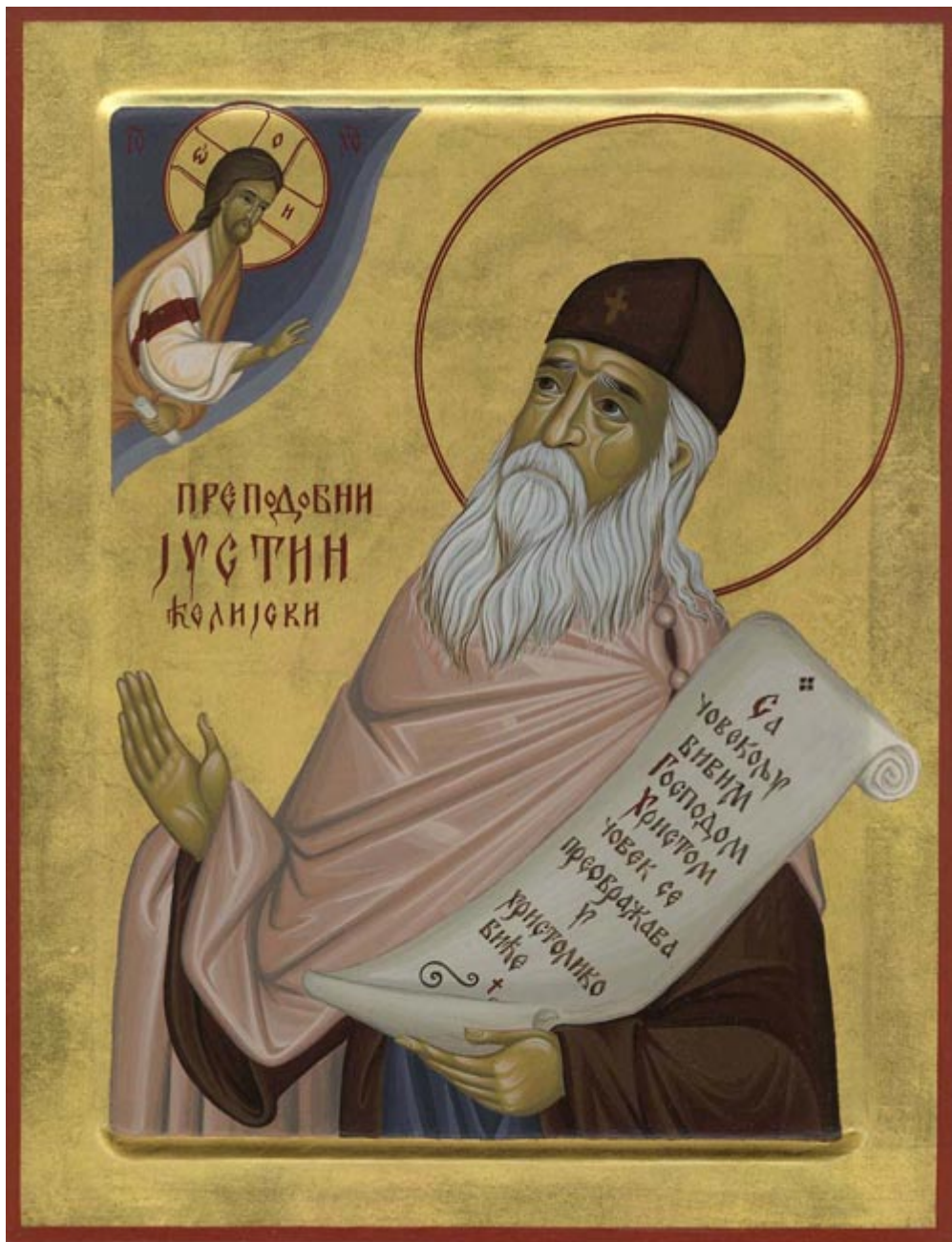
Ο άγιος Ιουστίνος Πόποβιτς

Το έργο του αγίου Ιουστίνου, η ουσιαστική συνεισφορά του για τη θεραπεία της πνευματικής ασθένειας της εποχής μας, προχωρεί περισσότερο. Αν, σε ολόκληρο το συγγραφικό του έργο, γίνεται συνεχώς επίκληση του Θεανθρώπου, αυτό γίνεται για να υπογραμμιστεί στην εποχή μας, και σε πείσμα της, ότι η «Θεανθρωπότης» είναι το μέτρο και το κριτήριο όλων των αξιών, και ότι ο Θεάνθρωπος, ο οποίος αποκαλύπτεται στον άνθρωπο ως ο αυθεντικός άνθρωπος, είναι ο σκοπός για τον οποίον είναι «κεκλημένος εις την θέωσιν του προσώπου του διά της ολοκλήρωσεως αυτού εν τη Εκκλησία», η οποία είναι αυτό τούτο το Σώμα του Θεανθρώπου.