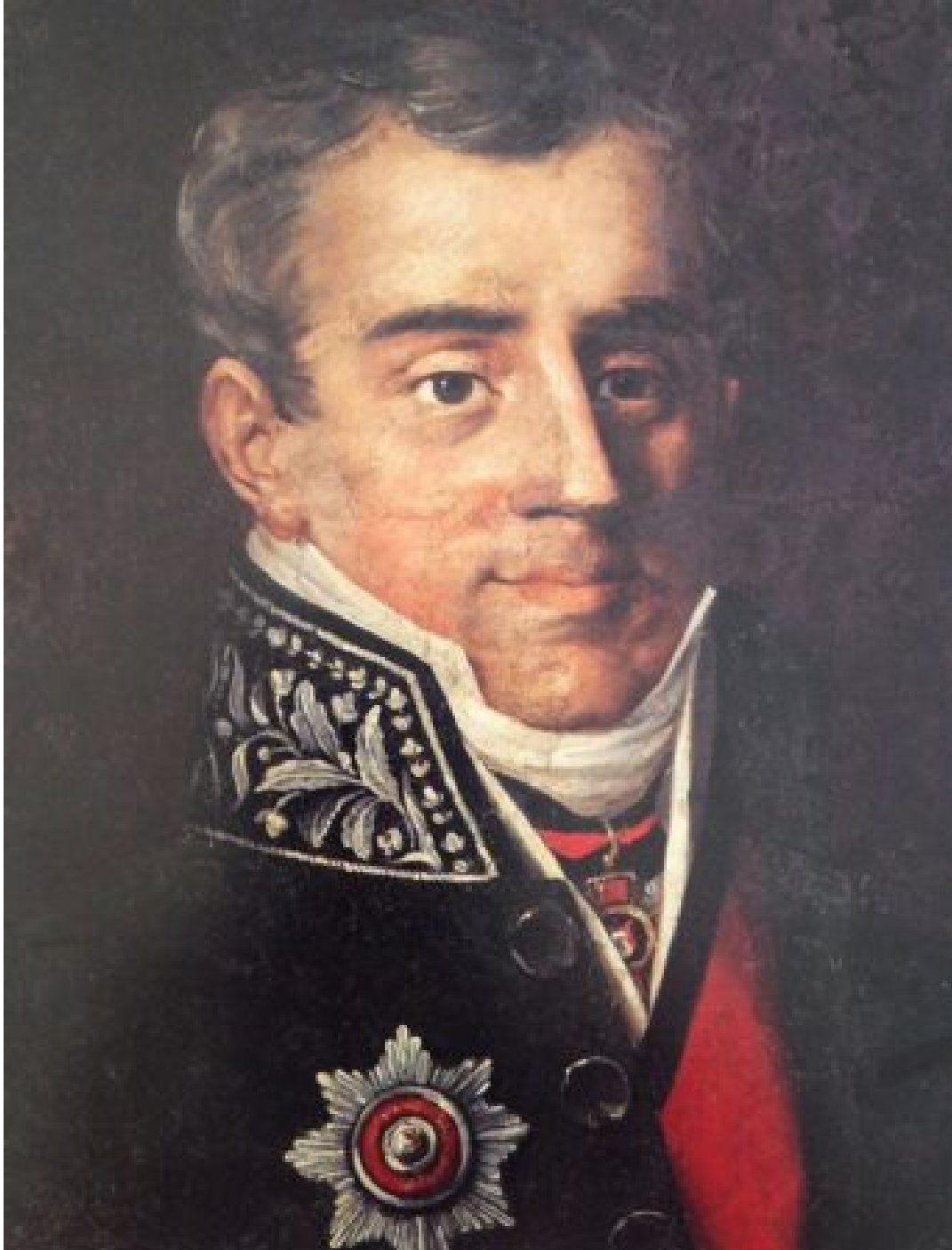
Ο πρώτος κυβερνήτης της Ελλάδος Ιωάννης Καποδίστριας.