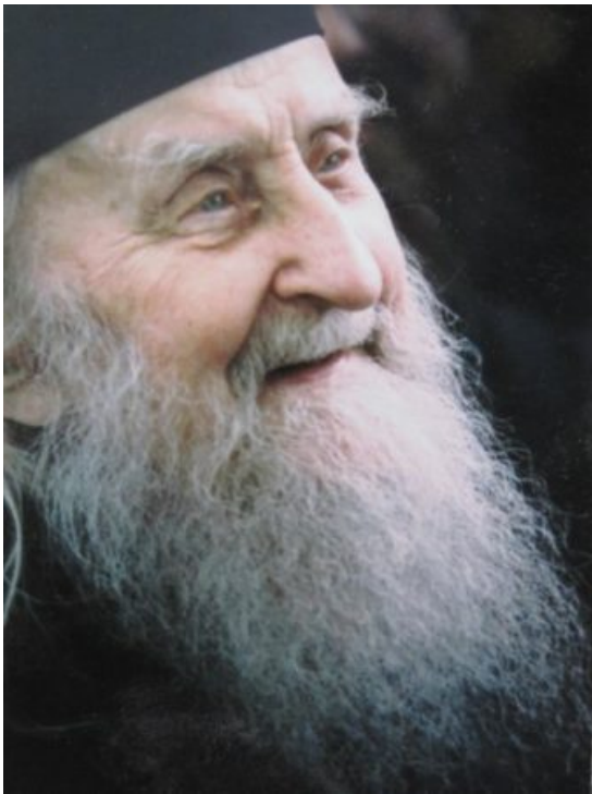
Όσιος Σωφρόνιος του Έσσεξ.