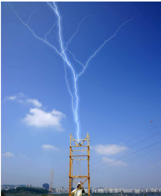
Alferd Lenz (Αυστρία), LIGHTNING, Εγκατάσταση, Επαναλαμβανόμενο βίντεο, 2014 (www.alfredlenz.com)

Το Μορφωτικό Ίδρυμα Εθνικής Τραπέζης διοργανώνει και παρουσιάζει την έκθεση εικοσιτριών διεθνών καλλιτεχνών «ΚΑΙΡΟΣ, Ανακάλεσμα της Γης». Πρόκειται για ένα εγχείρημα στη διασταύρωση μεταξύ εικαστικών τεχνών, μετεωρολογίας και φιλοσοφίας σε επιμέλεια της Σοφίας Παντελιάδου.