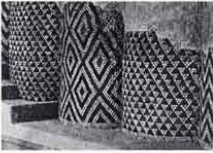
Ουρούκ, 4.000 π.Χ

Το ψηφιδωτό εμφανίστηκε κατά την πρωτοϊστορική εποχή στη Μεσοποταμία (τέλη της 4ης χιλιετηρίδας) σε ναό της Ουρούκ, υπό μορφή ημικίωνων, διακοσμημένων με πήλινα καρφιά που έφεραν έγχρωμη κεφαλή, σχηματίζοντας γεωμετρικά σχέδια, κόκκινα μαύρα και άσπρα. Στη δυτική Μ. Ασία σώζονται τα παλαιότερα δείγματα ψηφιδωτών δαπέδων με χονδροειδή χαλίκια, ένθετα σε πρωτόγονου τύπου κονίαμα (Γόρδιο, κοντά στην Άγκυρα, 8ος π.Χ. αι.)