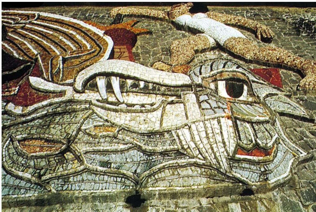
Ψηφιδωτό του σταδίου Ντιέγκο Ριβέρα, 1957

Μεγάλοι ζωγράφοι όπως ο Braque, ο Matisse, ο Chagal, έκαναν σχέδια των οποίων η μεταφορά στο ψηφιδωτό δεν ήταν ιδιαίτερα επιτυχής. Ο ψηφιδογράφος πρέπει να είναι καλλιτέχνης με βαθιά γνώση των ιδιοτήτων της ψηφίδας. Θα μπορούσε ακόμη αν θελήσει να βασιστεί η να εμπνευστεί από έργα μεγάλων ζωγράφων, πράγμα απόλυτα θεμιτό και που έχει γίνει από πολλά και μεγάλα ονόματα στο χώρο των εικαστικών τεχνών. Αυτό σημαίνει ότι οι ψηφίδες, δεν πρέπει να γεμίζουν απλά προϋπάρχοντα σχήματα σαν χειροτεχνία, αλλά να ερμηνεύεται το έργο στην δική τους γλώσσα. Για να γίνει κατανοητό φανταστείτε μεγάλους ποιητές και συγγραφείς μεταφρασμένους αυτολεξεί με ηλεκτρονικό υπολογιστή. Στην καλύτερη περίπτωση να μην υπάρχουν ορθογραφικά λάθη.