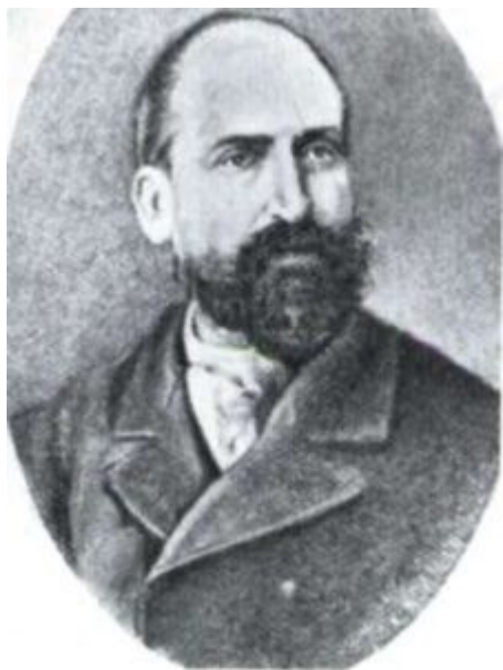
Ο Αλέξανδρος Μωραϊτίδης σε νεαρά ηλικία.

Θα συνεχίσει τη γυμνασιακή του φοίτηση στη Σύρο ενώ αργότερα θα σπουδάσει στη Φιλοσοφική σχολή της Αθήνας. Δίδαξε για 25 περίπου χρόνια σε διάφορα σχολεία ενώ παράλληλα αρθρογραφούσε στην “Εφημερίδα” του Κορομηλά, στο «Μη χάνεσαι» και στην “Ακρόπολι” του Γαβριηλίδη και σε άλλες εφημερίδες και περιοδικά. Σ’ αυτά δημοσίευε τα εορταστικά του διηγήματα (Χριστουγεννιάτικα και Πρωτοχρονιάτικα) αλλά και τα ηθογραφικά του, τα οποία κυριαρχούνται από έντονη θρησκευτικότητα και αγάπη για τη φύση, καθώς και τις ταξιδιωτικές του εντυπώσεις. Πρόκειται για μια πλειάδα άρθρων, καρπό της πολύχρονης γνωριμίας του με τόπους της ελεύθερης και αλύτρωτης τότε Ελλάδας ή περιοχές προσκυνήματα, τις οποίες επισκέφτηκε είτε ένεκα αναψυχής είτε ως απεσταλμένος εφημερίδων.