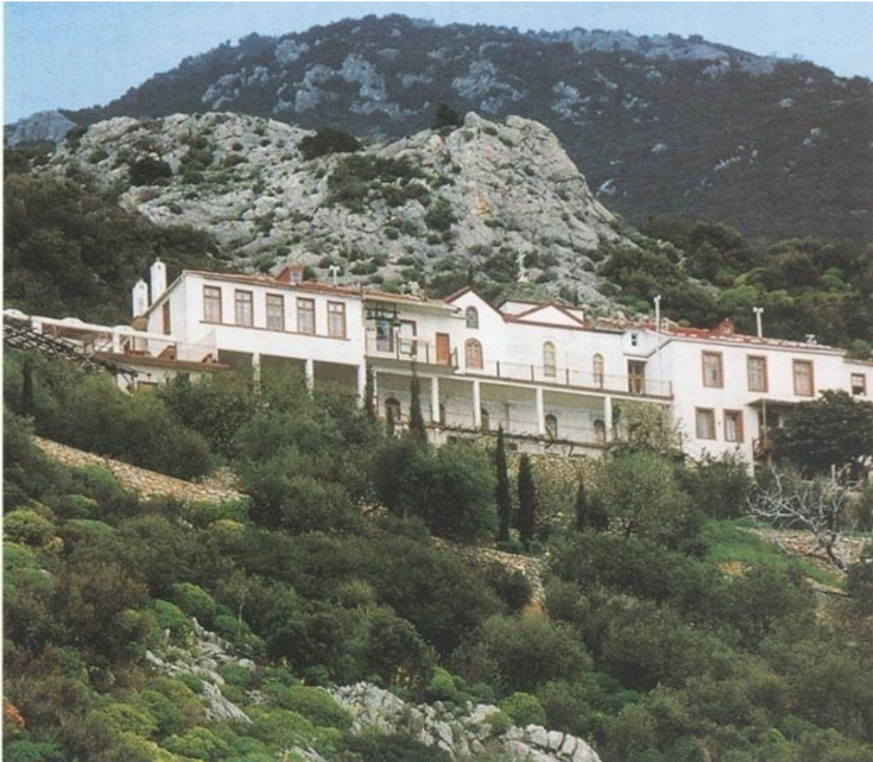
Η Σκήτη των Δανιηλαίων σήμερα.

Η γνωριμία του με τον γέροντα έπαιξε καθοριστικό ρόλο στην προσήλωσή του στο μοναστικό ιδεώδες, διατηρούσε δε αλληλογραφία με τον Όσιο Δανιήλ, καθ' όλη την υπόλοιπη ζωή του. Το αρχείο των επιστολών αυτών βρέθηκε στα χέρια του αείμνηστου καθηγητού Ιωάννη Φραγκούλα, του ιστορικού της Σκιάθου, το οποίο δυστυχώς κάηκε μαζί με το σπίτι του τον Αύγουστο του 1944, όταν οι Γερμανοί πυρπόλησαν το χωριό της Σκιάθου σε αντίποινα. Σώζονται ωστόσο επιστολές στην Σκήτη των Δανιηλαίων.