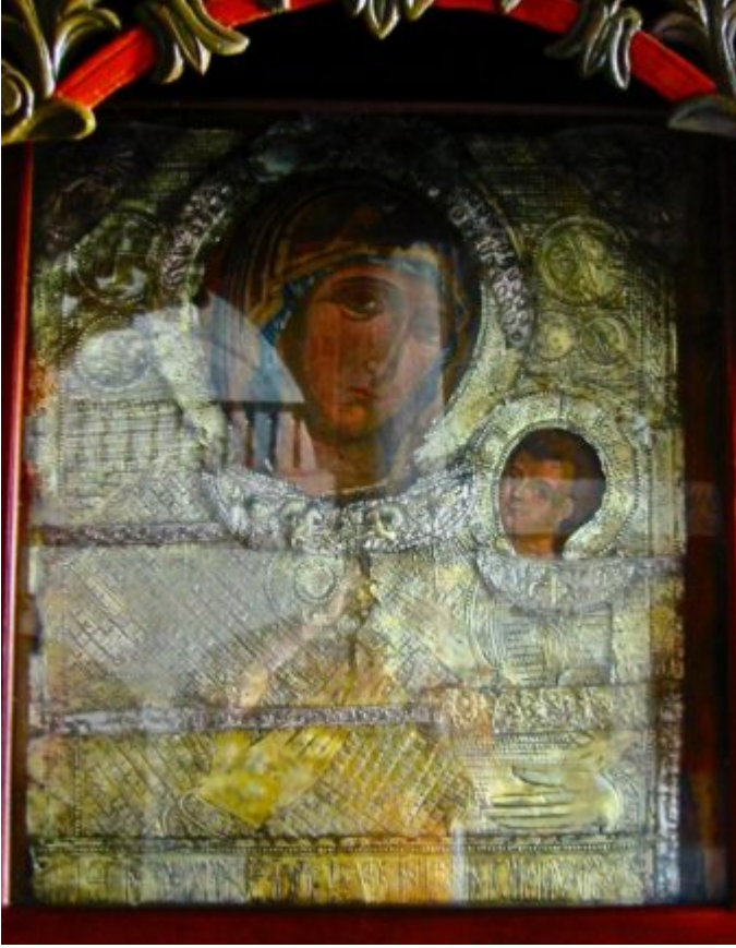
Αποκορύφωμα της λατρείας και της

πίστης ο Δεκαπενταύγουστος, η γιορτή της Παναγίας ανέκαθεν ήταν το σταθερό και επαναλαμβανόμενο κάλεσμα για το πιο όμορφο, το πιο μελωδικό συναπάντημα.