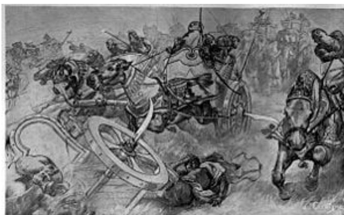
THE CHARGE OF THE TROOP ON THE CHARIOTS.

ελληνικό στρατόπεδο σφαγιάζοντας τους υπηρέτες και τους ιπποκόμους, παρά την αρχική αντίσταση των Θρακών που δέχθηκαν επίθεση από πίσω από τους αιχμαλώτους και κατατροπώθηκαν. Άλλοι Ινδοί, Πέρσες και Πάρθοι ιππείς άρχισαν να πλαγιοκοπούν το θεσσαλικό ιππικό, με αποτέλεσμα ο Παρμενίων να ζητήσει βοήθεια από τον Αλέξανδρο. Ο Αλέξανδρος, μαθαίνοντας τι συνέβαινε στους άλλους τομείς του μετώπου, έσπευσε να ενισχύσει τα πιεζόμενα τμήματα του χτυπώντας την αδιάσπαστη δεξιά πλευρά των Περσών. Χτυπάει πρώτα τους Ινδούς και τους Πάρθους που επιστρέφουν κυνηγημένοι από το στρατόπεδό του. Στη σύγκρουση αυτή σκοτώθηκαν 60 Εταίροι και τραυματίστηκαν βαριά ο Ηφαιστίωνας και ο Μενίδας. Κατόπιν, συνέχισε την επίθεσή του ο Αλέξανδρος προς ενίσχυση των ανδρών του Παρμενίωνα, αλλά οι Πέρσες, έχοντας πλέον αντιληφθεί την υποχώρηση του υπόλοιπου στρατεύματος, τράπηκαν σε φυγή, καταδιωκόμενοι από τους ιππείς του Παρμενίωνα. Ακολούθησε γενική καταδίωξη των ηττημένων, έως ότου έπεσε το σκοτάδι.