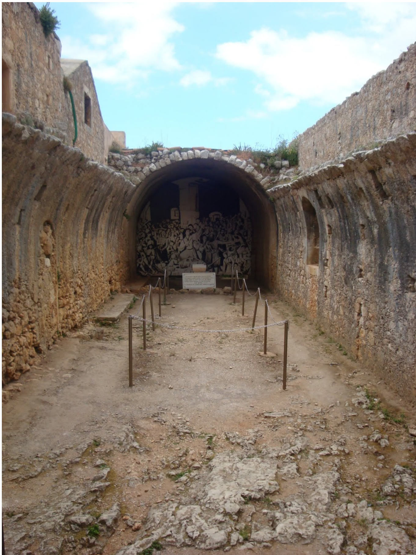
Έτσι ο Γιαμπουδάκης πήγε ν' ανταμώσει τον καλόγερο Σαμουήλ και τον Χρήστο