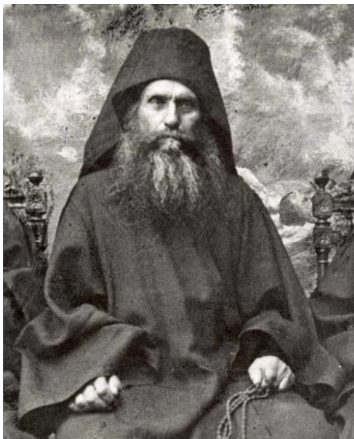
Άγιος Σιλουανός ο Αθωνίτης (1866-1938).