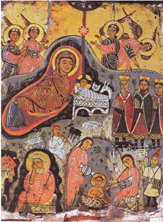
Η γέννηση του Χριστού - Εγκαυστική εικόνα από τη Μονή Αγίας Αικατερίνης Σινά 7ος αι.

Στο άλλο άκρο, απέναντι από τον Ιωσήφ, παρουσιάζονται δυο γυναίκες, που ετοιμάζουν το λουτρό του νεογέννητου. Η μία, ηλικιωμένη, κρατά στην αγκαλιά της γυμνό τον Ιησού και με το χέρι της φαίνεται να δοκιμάζει τη θερμοκρασία του νερού, ενώ η άλλη, νέα στην ηλικία, αδειάζει νερό μέσα στην κολυμβήθρα. Αυτή η σκηνή είναι παρμένη από το απόκρυφο ευαγγέλιο του Ιακώβου, όπου αναφέρεται ότι στο στάβλο ο Ιωσήφ έφερε μια μαία και τη Σαλώμη, για να βοηθήσουν τη Θεοτόκο.