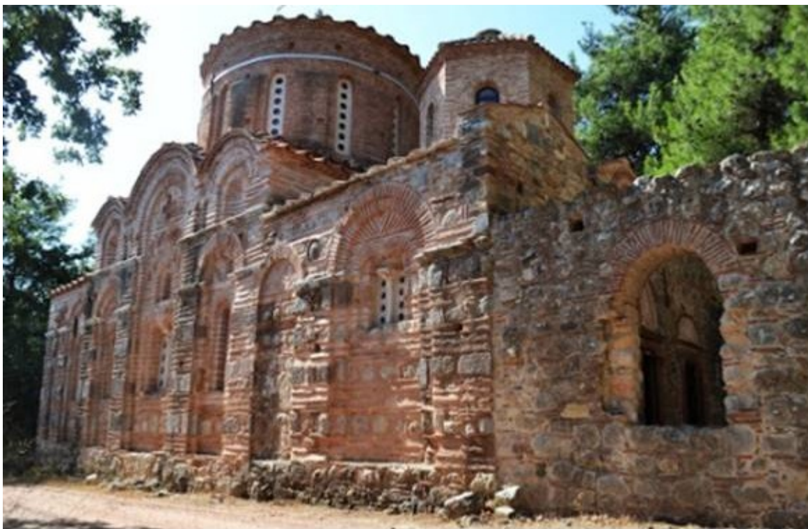
Ναός Παναγίας Κρίνας

Θεωρώ ότι έχουμε χρέος όλοι μας οι παρεπίδημοι στην γη, να μην σπαταλούμε άσκοπα τον χρόνο μας, αλλά να τον εξαγοράζουμε σύμφωνα με την προτροπή του Αποστόλου των Εθνών: «Βλέπετε πως ακριβώς περιπατείτε, μη ως άσοφοι, αλλ' ως σοφοί, εξαγοραζόμενοι τον καιρόν, ότι αι ημέραι πονηραί εισιν» (Εφεσ. ε' 15 ). Έχουμε χρέος να αξιοποιούμε τον χρόνο μας με αγάπη προς τον πλησίον, με δικαιοσύνη, με σωφροσύνη και με αδιάλειπτη προσευχή προς τον άχρονο Δημιουργό και Κυρίαρχο των καρδιών μας. Και να μην λησμονούμε ότι το τέλος μας είναι εγγύς, πλησιάζει το τέλος του χρόνου μας πάνω στην γη, που το πότε θα έρθει κανείς δεν το γνωρίζει. Έρχεται όπως ο κλέπτης την νύχτα και κλέβει τις ψυχές μας. «Η ημέρα Κυρίου ως κλέπτης εν νυκτί ούτως έρχεται» μας προειδοποιεί ο ουρανοβάμων Απόστολος στους Θεσσαλονικείς (Κεφ. ε' 1-8).