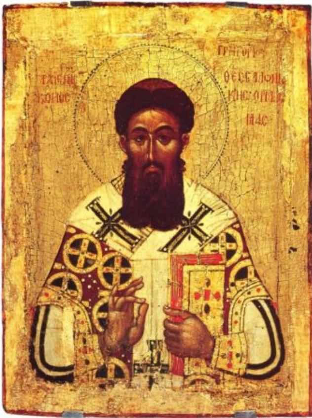
Άγιος Γρηγόριος Παλαμάς, Αρχιεπίσκοπος Θεσσαλονίκης (1296-1360).