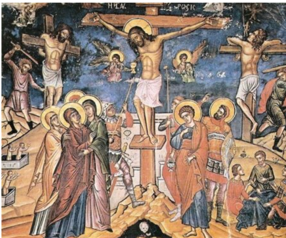
Η Σταύρωσις. Τοιχογραφία Θεοφάνη του Κρητός, Ιερά Μονή Σταυρονικήτα Αγίου Όρους.

Στέκομαι, λοιπόν, πρώτα σ' εκείνο το σπαρακτικό κείμενο της ακολουθίας των Παθών. Στον εκφωνούμενο σπαρακτικώς λόγο της εισόδου του Σταυρού, σε Ήχο πλ. β', που εκφωνούν οι ιερείς και επαναλαμβάνουν άδοντες οι χοροί.