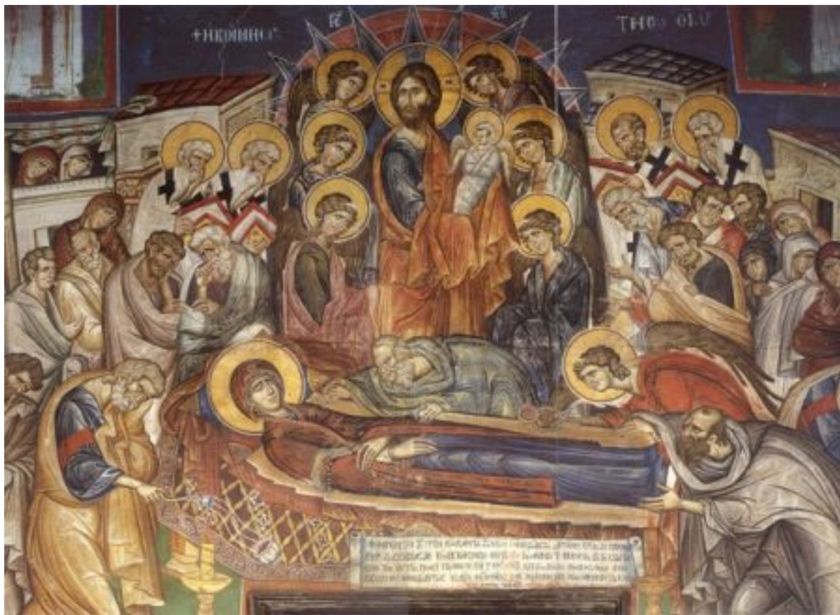
Η Κοίμηση της Θεοτόκου. Τοιχογραφία Καθολικού Ιεράς Μεγίστης Μονής Βατοπαιδίου (1312).