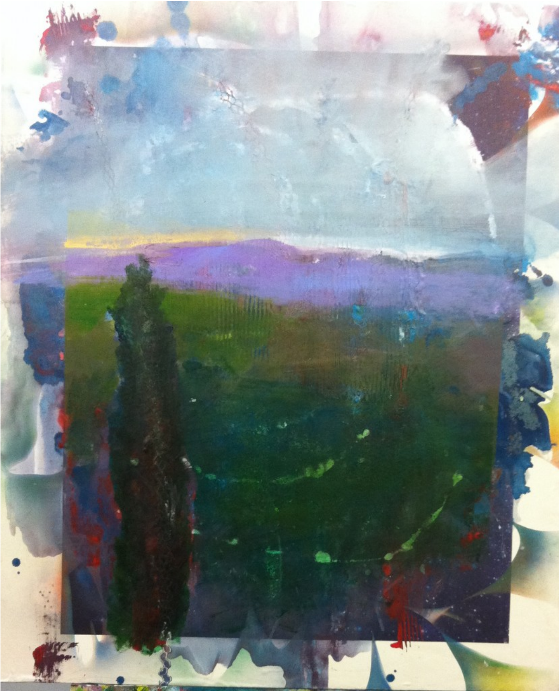
Φωκίδα - Μανώλης Χάρος 120X80 Ακρυλικά Σε Μουσαμά

-? ????????? ???? ????? ?????????? ??????? ?? ?????????? ??? ??????????;