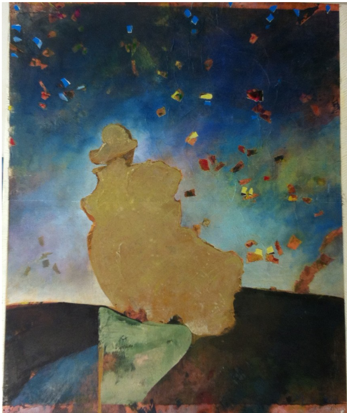
Μοναχός Μανώλης Χάρος 120Χ100 Μεικτή Τεχνική Σε Καμβά

Τα έργα αποτελούν μία ενότητα επιλεγμένη με περίσκεψη, μια ενότητα γραφής και σκέψης, και φέρουν τα σημάδια των καιρών. Σχολιάζουν την πραγματικότητά μας, διαλογίζονται και αποτελούν προσωπική πρόσκληση στον κάθε θεατή να περιηγηθεί στον εικαστικό τόπο του καλλιτέχνη.