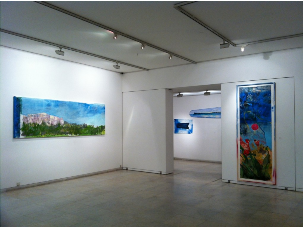
Μανώλης Χάρος Γκαλερί Ζουμπουλάκη 2

Αυτό είναι το έργο που θα παρουσιάσει ο καλλιτέχνης στην έκθεση.