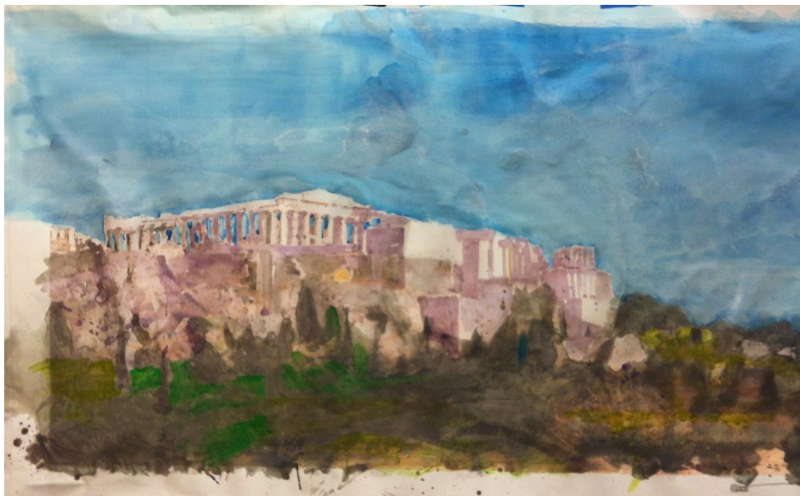
Ακρόπολη - Μανώλης Χάρος- 100x300 λεπτομέρεια Ακρυλικά Σε Καμβά

Μέχρι τις 7 Απριλίου θα διαρκέσει η έκθεση του ?????? ?????? που παρουσιάζεται στη γκαλερί Ζουμπουλάκη. «? ????????, ? ??????? ??? ?????? ?????????? ?????» . Πρόκειται για μια σειρά έργων, που έχουν δημιουργηθεί από το 2008 έως σήμερα.