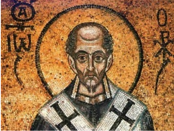
Άγιος Ιωάννης Χρυσόστομος.

είπαν στον Χριστό, εκεί στην έρημο της Γαλιλαίας, που προανέφερα, ότι «Δεν έχουμε άρτους», ο Χριστός τους είπε, «να τους δώκετε να φάνε». «Μα, έχουμε πέντε..».. «Φέρτε τα δω», λέει. Ύψωσε το βλέμμα, τα ευλόγησε, τα 'κοψε κομμάτια και τα 'δινε στους Αποστόλους. Και οι Απόστολοι τα εμοίραζαν.