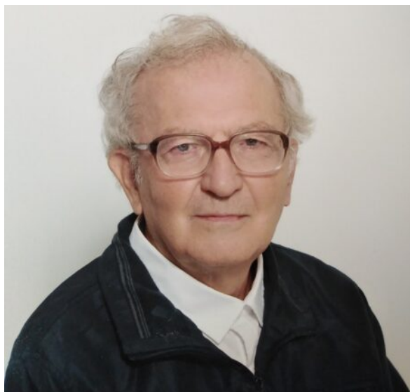
Ο συγγραφέας Γιάννης Πατσώνης.