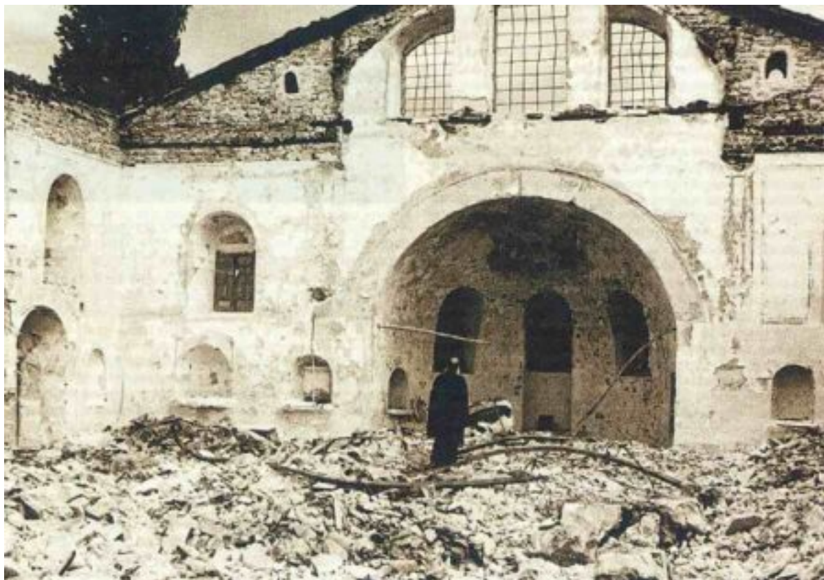
Ο Πατριάρχης Αθηναγόρας προσεύχεται μπρος στην αναποδογυρισμένη Αγία Τράπεζα της κατεστραμμένης Παναγίας Βελιγραδίου (Μπελγρατκαπού).