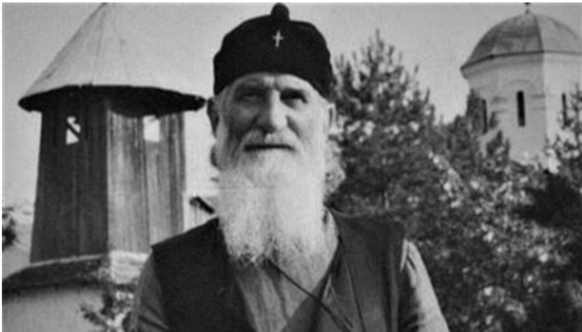
Όσιος Ιουστίνος Πόποβιτς (1894-1979).