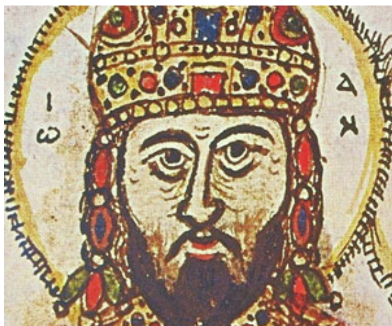
Άγιος Ιωάννης Βατάτζης, ο βασιλεύς και ελεήμων.