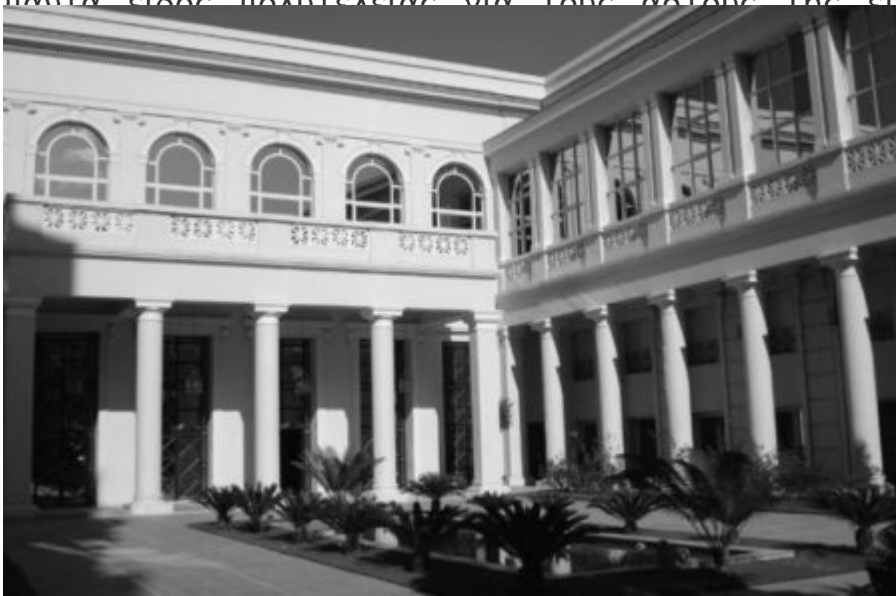
Σύντομα η επιχείρησή τους

Ο μεγάλος Έλληνας επιχειρηματίας και ευεργέτης είδε το φως της ζωής στο Μέτσοβο στις 3 Ιανουαρίου του 1789. Πατέρας του ήταν ο εξαίρετος γουναράς Αναστάσης Τσιότσας στην Θεσσαλονίκη. Έμαθε τα πρώτα του γράμματα στο Μέτσοβο και εν συνεχεία κατέφυγε στην Θεσσαλονίκη, συνεχίζοντας με τις βασικές του σπουδές, ενώ στην ηλικία των δεκατεσσάρων ετών στα 1806, ανέλαβε με τα αδέρφια του την διεύθυνση του καταστήματος επεξεργασίας γουναρικών του πατέρα τους. Ο νεαρός Μιχαήλ δαιμόνιος καθώς ήταν, μύηθηκε βαθιά στα μυστικά της γούνας και συνειδητοποίησε ενωρίς - δοθέντος ότι ήταν πάντα είδος πολυτελείας για τους αστούς της εποχής - ότι θα μπορούσαν έτσι στην γενέτειρά του το κής τους επιχείρησης εκεί.