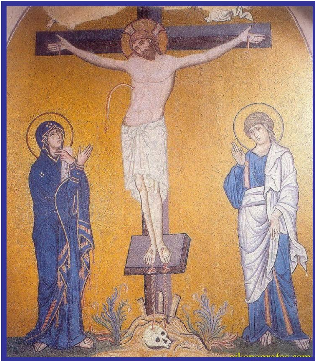
Η Σταύρωση ψηφιδωτό Μονής Δαφνίου

Κ' ἔγυρ Ἐκεῖνος το ἀχραντο κεφάλι και ξεψύχησε στο μαύρο το κορμί μου απάνου•