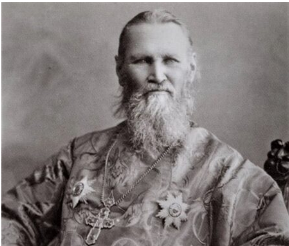
Άγιος Ιωάννης της Κροστάνδης (1829 - 1908).