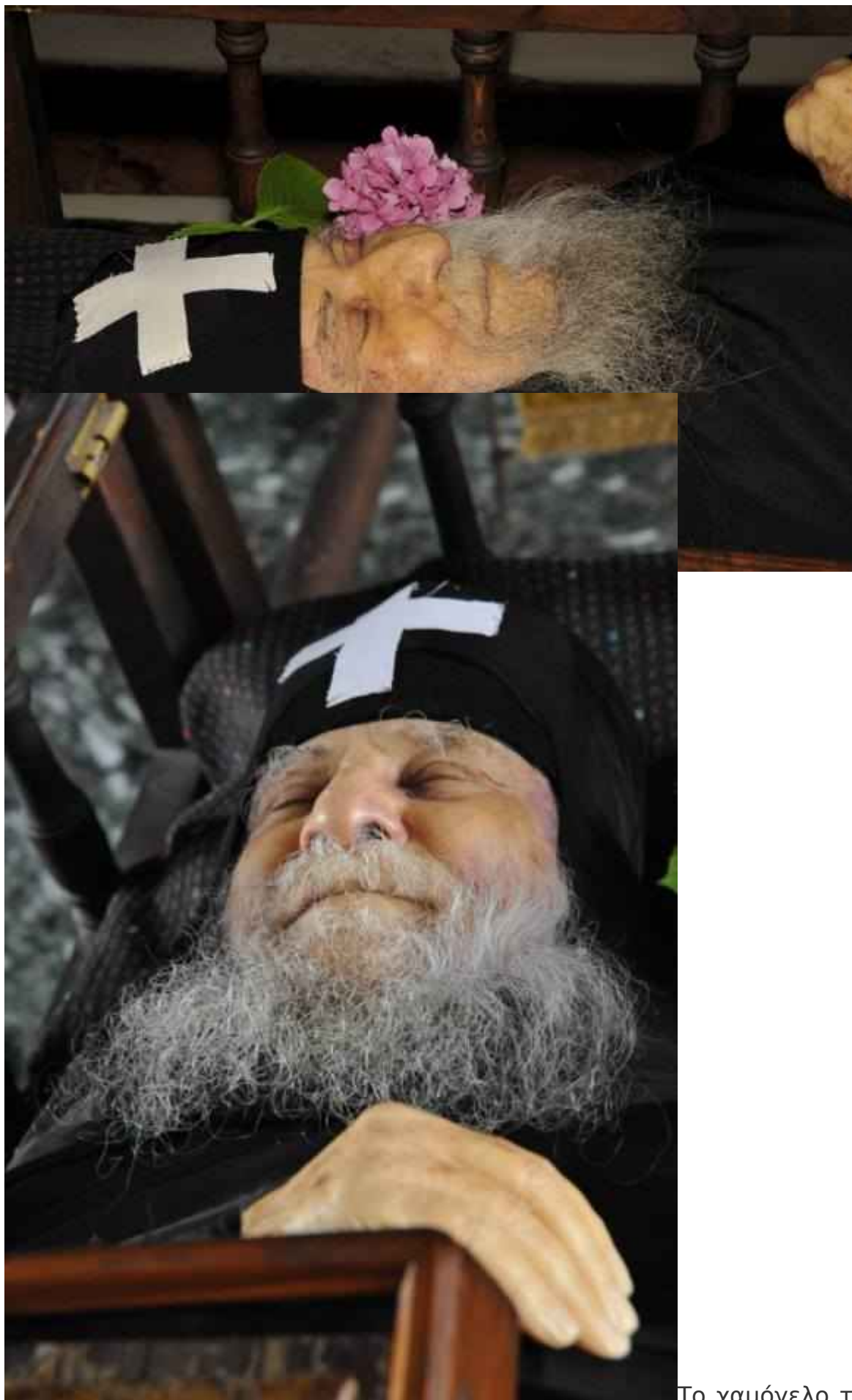
Το χαμόγελο του Γέροντος