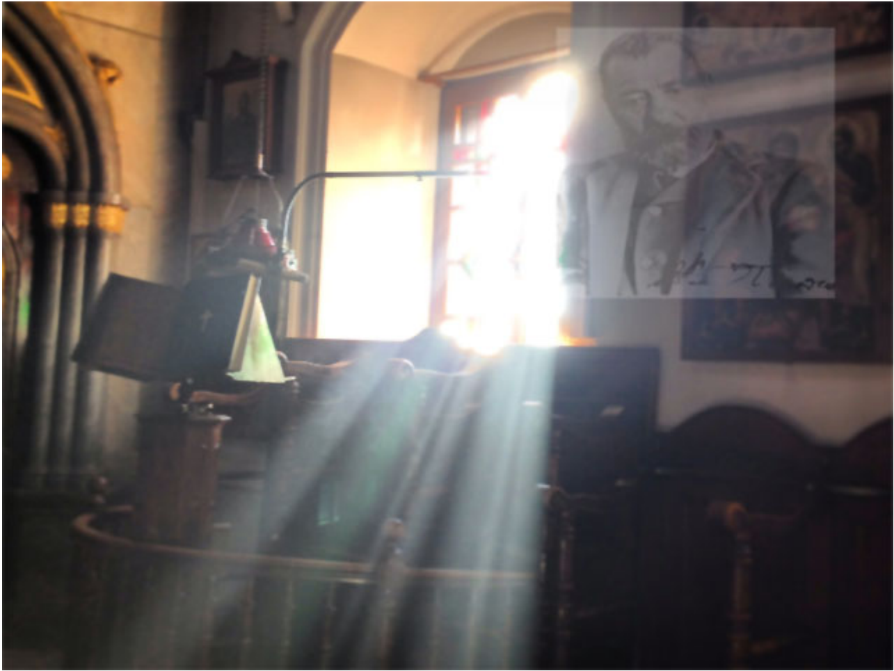
Το αναλόγιο των Τριών Ιεραρχών όπου έψαλε ο Παπαδιαμάντης κατά την παραμονή του στη Σκιάθο

δεν εννοεί να διηγείται ένα περιστατικό σχετικό με τα Χριστούγεννα, το Πάσχα και άλλες γιορτές χωρίς να κάνει αναφορά στα γεγονότα αυτά.