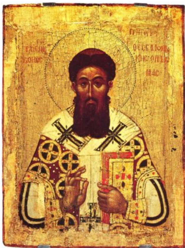
Άγιος Γρηγόριος Παλαμάς, Αρχιεπίσκοπος Θεσσαλονίκης.