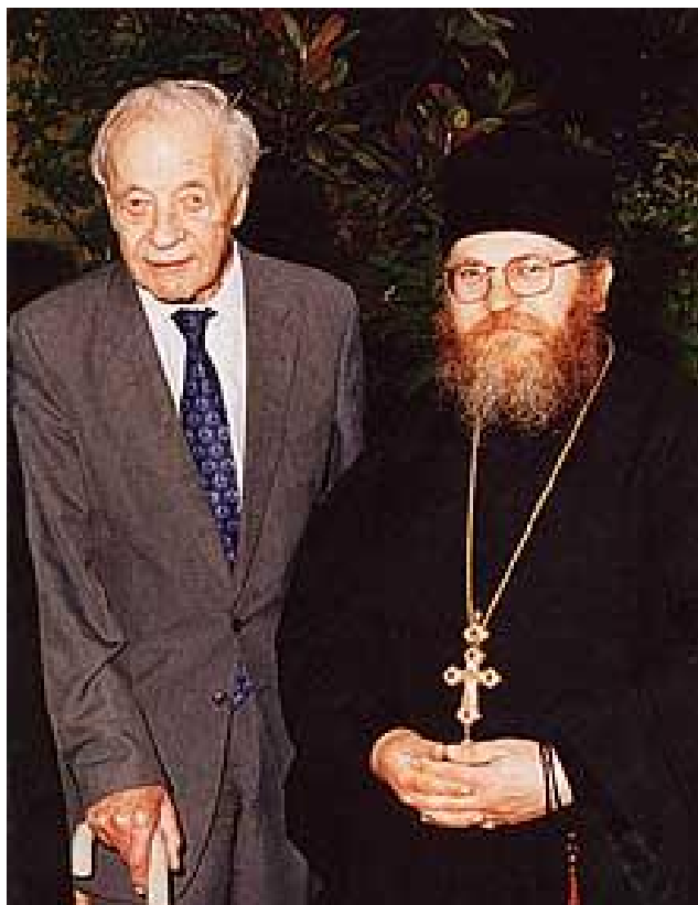
Ο βυζαντινολόγος, σερ Στίβεν Ράνσιμαν με τον Ηγούμενο της Ι.Μ.Μ. Βατοπαιδίου Αγίου Όρους, Γέροντα Εφραίμ κατά την επίσκεψή του στην Ιερά Μονή.

Ένας δυτικός ιστορικός Ευρωπαίος λέγει ότι «εάν οι Τούρκοι είχαν πάει στη Ρώμη ή στη Βιέννη ή στο Παρίσι, οι χριστιανοί εκείνων των τόπων, παπικοί κυρίως, δεν θα κρατούσαν ούτε δέκα χρόνια την άγια πίστη. Θα εξισλαμίζοντο». Τα λέει δικός τους, δεν ξέρω αν έχει δίκιο ή όχι, ας τα βρουν εκείνοι. Εγώ το διάβασα και το μεταφέρω στην αγάπη σας. Ίσως μερικοί το γνωρίζετε.