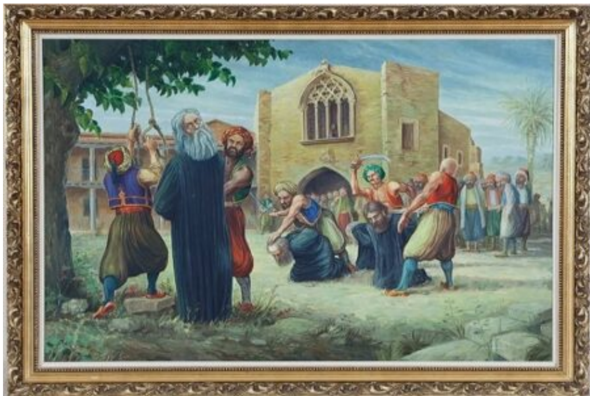
Ο απαγχονισμός του Αρχιεπισκόπου Κύπρου Κυπριανού, η καρατόμηση των τριών Μητροπολιτών και δεκάδων άλλων Κυπρίων, κληρικών και λαϊκών. Έργο του Γιώργου Μαυρογένη.