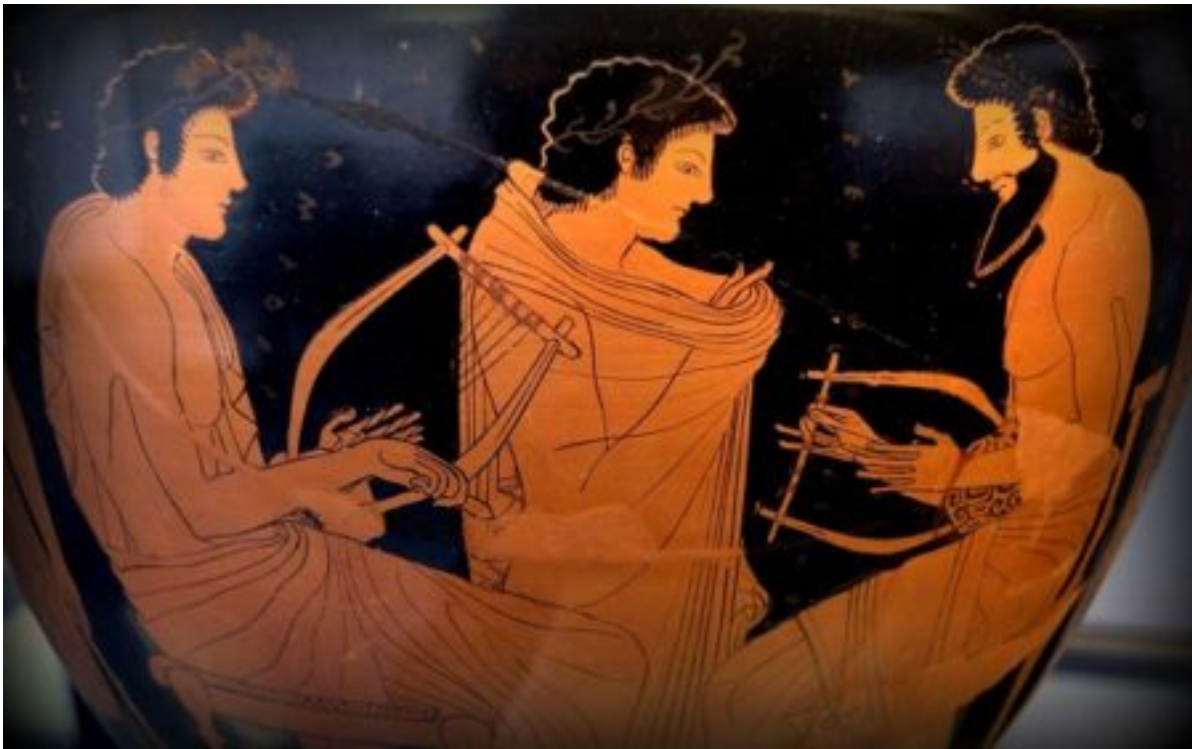
Μάθημα μουσικής στην αρχαία Ελλάδα.

Το διαχρονικό ενδιαφέρον για τη φυσιολογική ανάπτυξη των αθλητών και γενικά του αθλητισμού συνεχίζεται αμείωτο, ωστόσο, υποκλινόμαστε πάντα στους αρχαίους Έλληνες γιατί μας εκπλήσσουν με τα επιτεύγματά τους, οι οποίοι έδειχναν ενδιαφέρον στην ανάπτυξη του σώματος αλλά και της καλλιέργειας των αρετών. Το ρητό «νους υγιής εν σώματι υγιεί» ως έμβλημα για τους αρχαίους Έλληνες επεδίωκε την αριστεία του πνεύματος και του σώματος, αλλά αποτελούσε και αποτελεί έμπνευση σήμερα για τους καθηγητές φυσικής αγωγής, προπονητές και αθλητές που ακολουθούν το παράδειγμά τους.