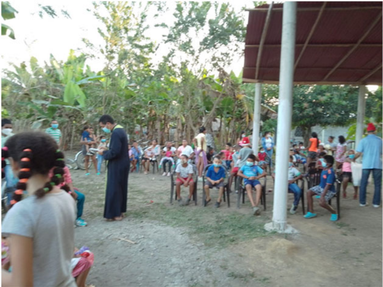
Κατήχηση με τους πιστούς