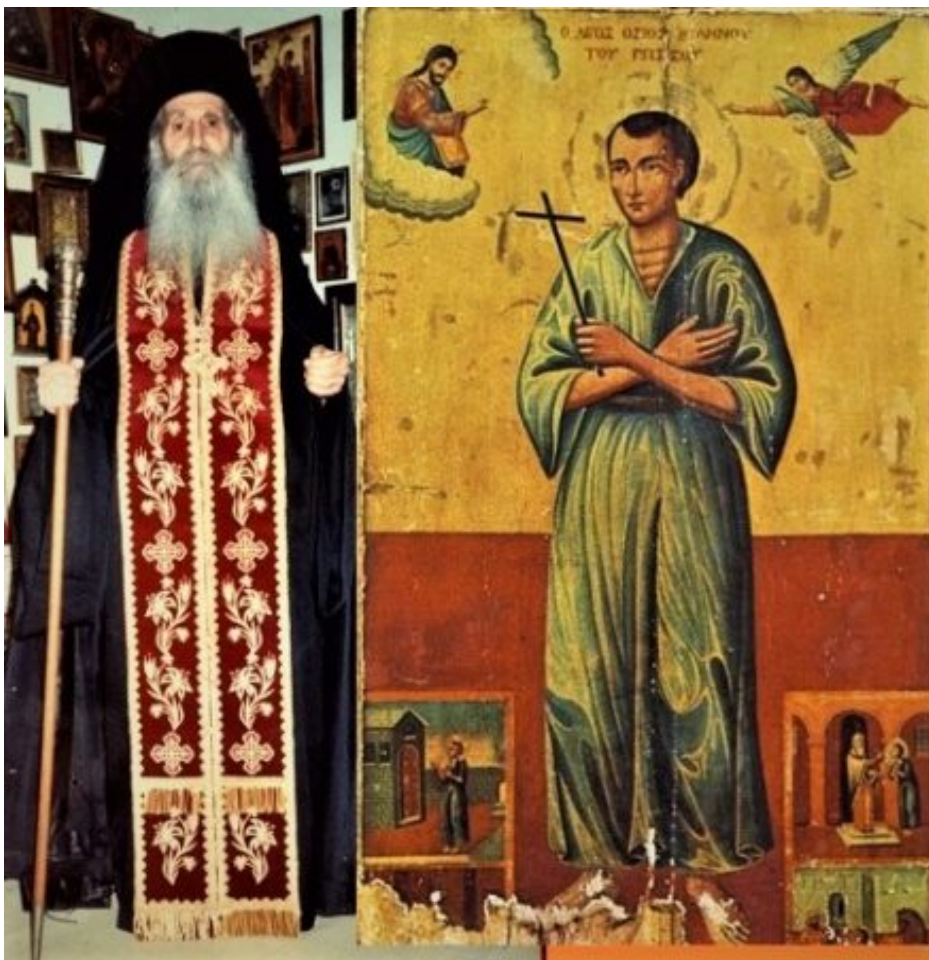
Οι άγιοι Ιάκωβος (Τσαλίκης) και Ιωάννης ο Ρώσος.