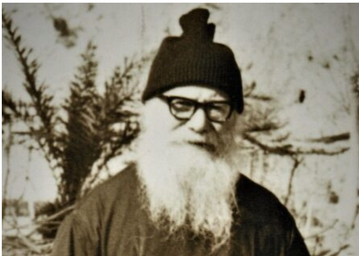
Όσιος Πορφύριος (1906-1991).