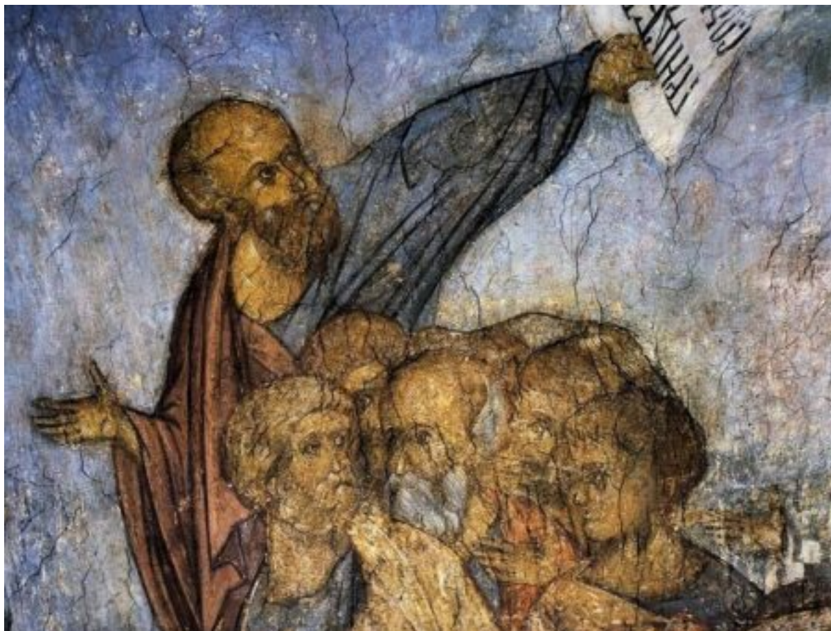
Απόστολος Παύλος (τοιχογραφία).

Ιδιαίτερο ενδιαφέρον παρουσιάζει η εκτός... προγράμματος άφιξη του Αποστόλου των Εθνών στην Μακεδονία και μάλιστα κατόπιν προσκλήσεως! Μια πρόσκληση που πραγματοποιήθηκε κατά τη διάρκεια ενυπνίου όταν βρισκόταν στην Τρωάδα, ενώ είχε εμποδιστεί και ουσιαστικά ακυρωθεί διά Πνεύματος Αγίου το προηγούμενο πρόγραμμα του!