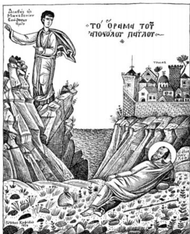
Το όραμα του Αποστόλου Παύλου. Σχέδιο του Ράλλη Κοψίδη από τον Μέγα Συναξαριστή της Εκκλησίας.

Και να, από το κομβικό αυτό σημείο του αρχαίου ελληνικού πολιτισμού θα «εκτοξευθεί» ένας νέος Όμηρος, και μάλλον πιο ώριμος που θα αποτελέσει έναν από τους σημαντικότερους και πιο καθοριστικούς διαμορφωτές του ευρωπαϊκού πνεύματος και πολιτισμού, και κατά συνέπειαν ολοκλήρου του Δυτικού πολιτισμού! (Ακόμη και με τις ποικίλες στρεβλώσεις που υιοθέτησε ο Δυτικός χριστιανισμός).