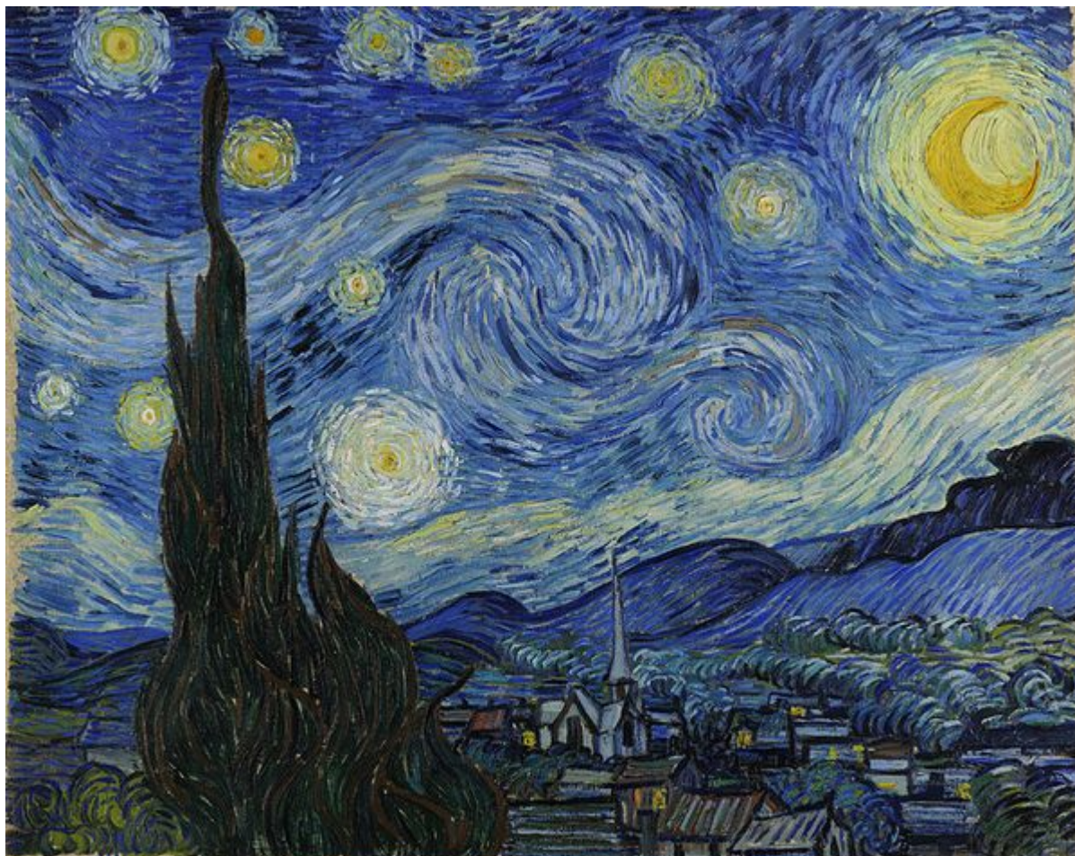
Βίνσεντ Βαν Γκογκ «Έναστρη Νύχτα»

Οι απαραίτητες μόνο επιθυμίες – και το κρανίο μου ολημερίς χώρος μετανοίας όπου η προσευχή παίρνει το σχήμα θόλου. Κύριε, ανήκα στους εχθρούς σου. Συ είσαι όμως τώρα που δροσίζεις το μέτωπό μου ως γλυκύτετη αύρα. Έβαλες μέσα μου πένθος χαρωπό και γύρω μου όλα πια ζουν και λάμπουν. Σηκώνεις την πέτρα – και το φίδι