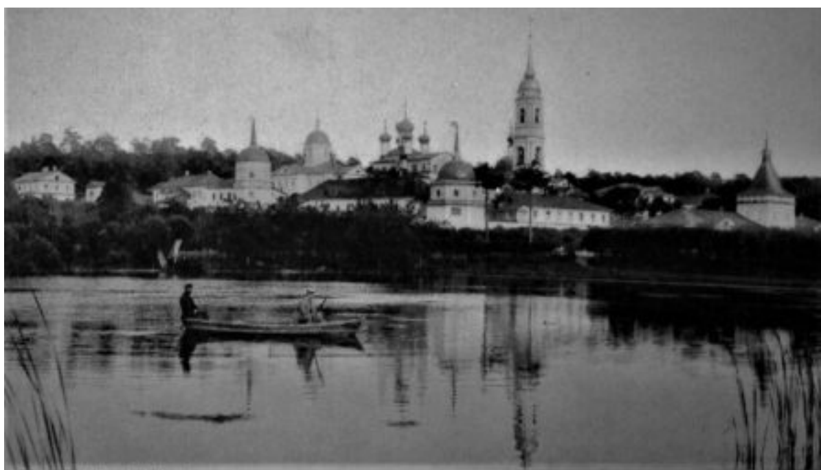
Η Μονή της Όπτινα.