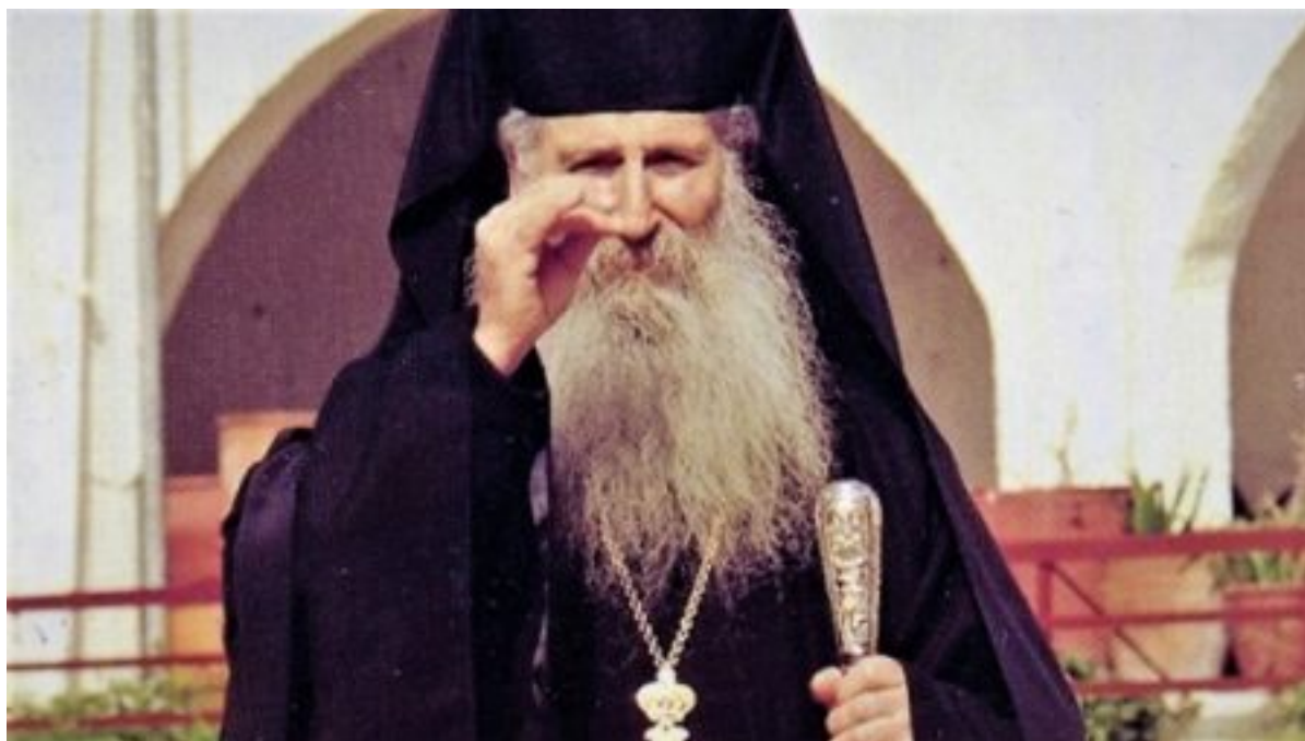
Άγιος Ιάκωβος (1920-1991).